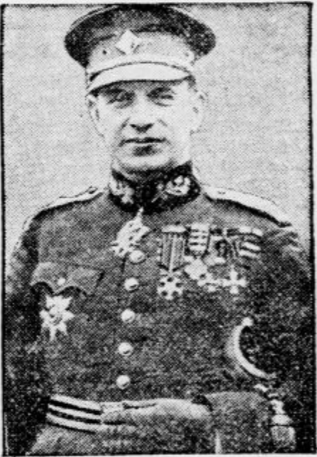
Rudolf Gajda odstavljeni šef češkoslovaškega generalnega štaba, je bil zaradi brnskega puča aretiran in odveden v ječo