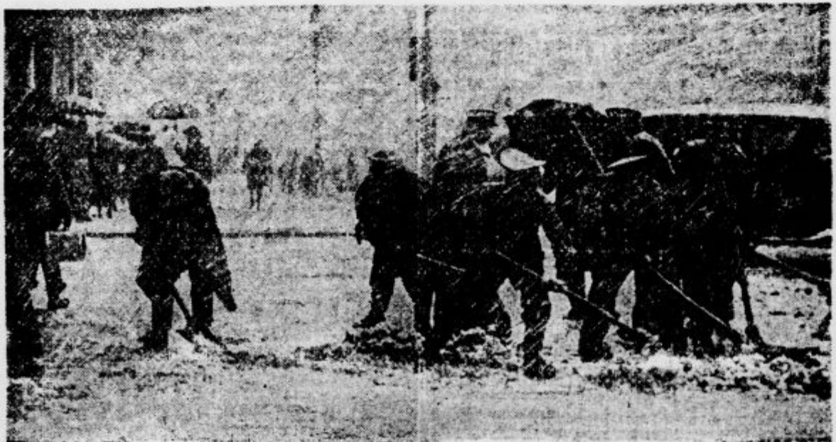
takšen sneg, da so morali hrastopci prijeti za kopala