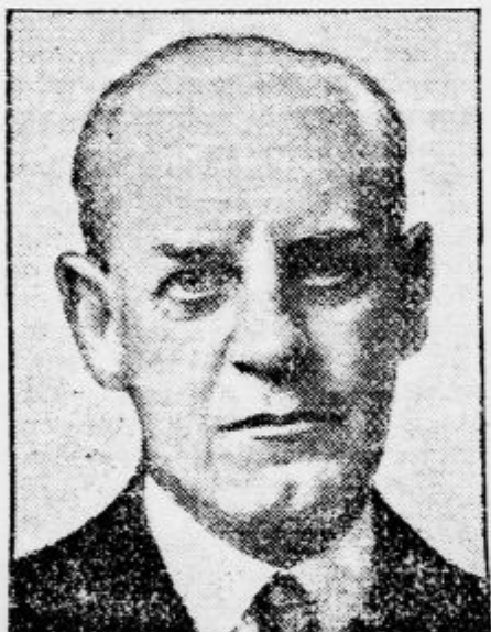
John Galsworthy pisatelj »Forsyte-Sage«, ki je bil odlikovan lani z Nobelovo nagrado, se bori s smrtjo. Zadel ga je kap