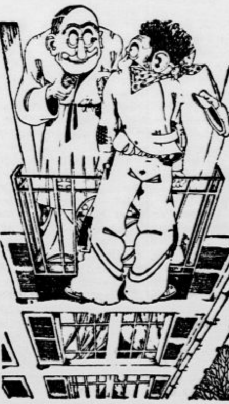
— Roke gor, ali pa streljam!