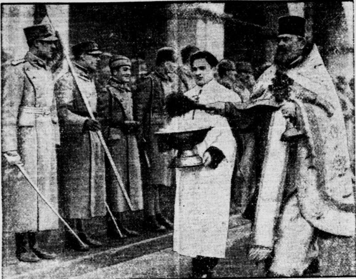
Prizor s obredov na praznik Bogojavljenja v Beogradu: vojni svečenik blagoslovlja vojaštvo, ki se je udeležilo cerkvene svečanosti

Te morete videti v nedeljo 29. I. v Bohinju