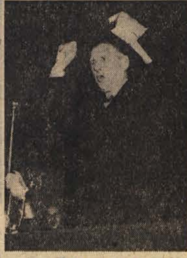
General Charles De Gaulle

Pariz, 19. maja (Tanjug). - General Charles De Gaulle, ki je v četrtki izjavil, da je pripravljen prevzeti oblast, se je davi odpeljal z avtomobilom iz Colomba v Pariz. Bivši vodja Gibanja zbiranja je napovedal za danes popoldne sestanek z novinarji. De Gaulle je prispel v Pariz ob 15. in imel v hotelu Palace d'Orsay napovedan sestanek z novinarji. Na njem je izjavil, da je nemara napočil čas, ko bi utegnil biti deželni znova neposredno koristen. Lahko bi bil koristen, kakor je bil koristen takoj po vojni na čelu vlade Francoske republike, če ljudstvo to hoče. Razlog, da bi lahko bil koristen, je tudi v tem, da ni vezan na nobeno stranko. Tisto, kar se je zgodilo v Franciji, v odnosu na Alžirijo, je dejal, in v Alžiriji v odnosu na Francijo, bi lahko povzročilo zelo hudo nacionalno krizo. Lahko pa bi to bil tudi začetek nekakšnega preporoda. Izključna vladavina strank ni urenila in ne more urediti važnih problemov, na katere je zadela Francija, zlasti ne povezave Francije z afriškimi narodi. Če pojde tako dalje, bi lahko režim sprejemal programe, ne bi našel pa izhoda iz sedanjega položaja. Na vprašanje, kaj je mislil, ko