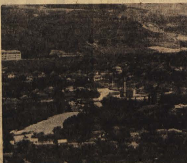
Pogled na mesto Peč in njegovo okolico