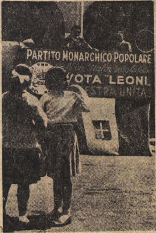
Volilna »zborovanja« monarhistov in drugih manjših strank potekajo te dni v Italiji pogosto tako, kakor kaže zgornja slika: oder z zastavami, emblemi, zvočniki in govornikom, na prostoru pred njimi pa ni zlepa nikogar. (Na sliki zborovanje, ki so ga organizirali monarhisti pred dnevi v Benetkah)

Razen neoriginalnih inčič »da je krščanska demokracija spriču komunistične nevarnosti edina alternativa«, je sekretar Krščanske demokracije Fanfani v Vicenzi in Benetkah »ponovil ponudbo bivšim zaveznikom za povoljno sodelovanje v vladi, vendar pa doslej še ni prejel nikakega vzpodbudnega odgovora. Če pa vse to povežemo z opozorilom liberalca in nekdanjega