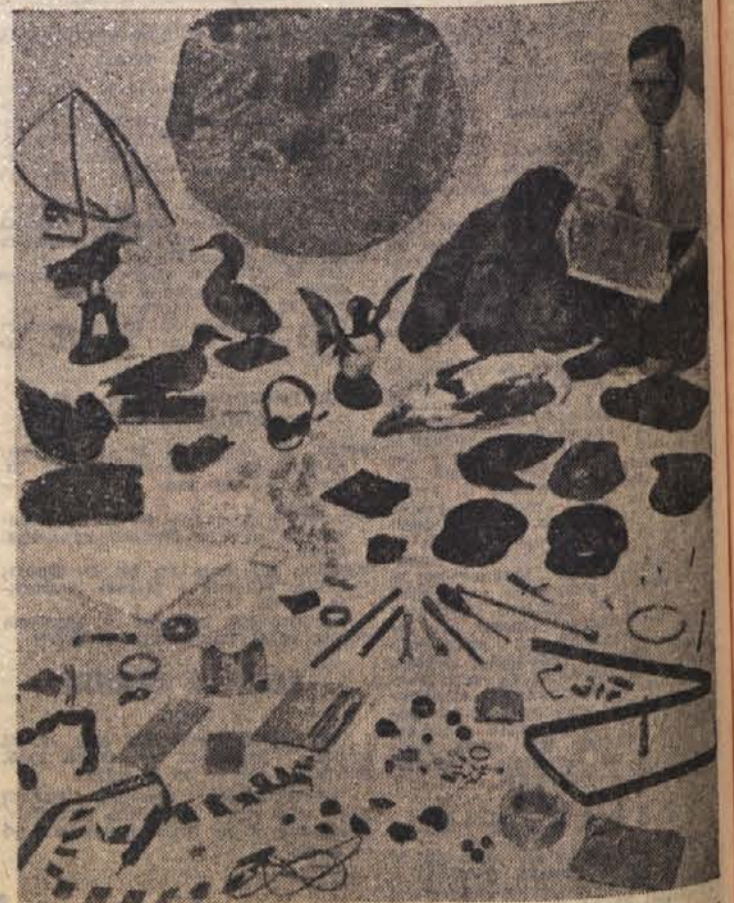
V odprtinah, skozi katere prihaja zrak v motorje reaktivnih letal, se lahko naberejo kaj različne stvari. Neke ameriške letalske družbe je zbirala predmete, ki jih je zračni pritisk potegnil v odprtino in so povzročili lažje okvare. Vrstijo se predmeti od kap žebeljev, obrobov in verižic pa do zastopnikov živalskega sveta, kot vidite na sliki

V neki vasi pri Kotoru imajo skoraj vsi člani neke družine na rokah in nogah po šest prstov. Hči enega izmed bratov, ki imata po šest prstov, je rodila šest otrok s šestimi prsti na rokah in nogah ter dva, ki imata po pet prstov. Zanimivo je, da je šesti prst lahko odstraniti z operacijo, vendar se starejši člani te družine ne dajo operirati.