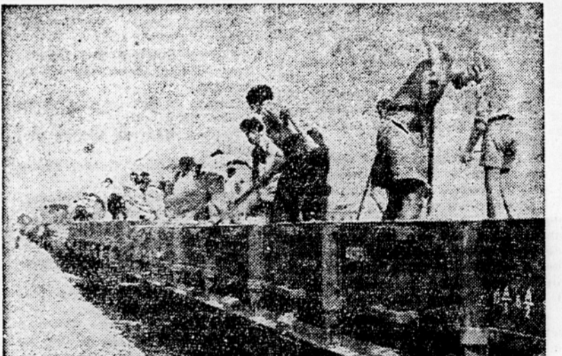
Gojenec Srednje tehnične šole v Ljubljani so se za uvod v novo šolsko leto udeležili pretekli petek prostovoljnega dela. 444 dijakov, med njimi okrog polovice novincev, je delalo v Litostroju 6 ur. Izkopali, razstvorili, premetali in prevozili so čez 1150 kub. m gromača, splantrali 105 kv. m cestišča in prenesli 4800 kg železa.

Ti uspehi so bili doseženi zaradi stalnega tekmovanja v vseh oddelkih tovarne. V tovarni je bilo dosedaj normiranih 70% del, medtem ko je pri delih, ki jih ni mogoče normirati, uveden akordni sistem dela.