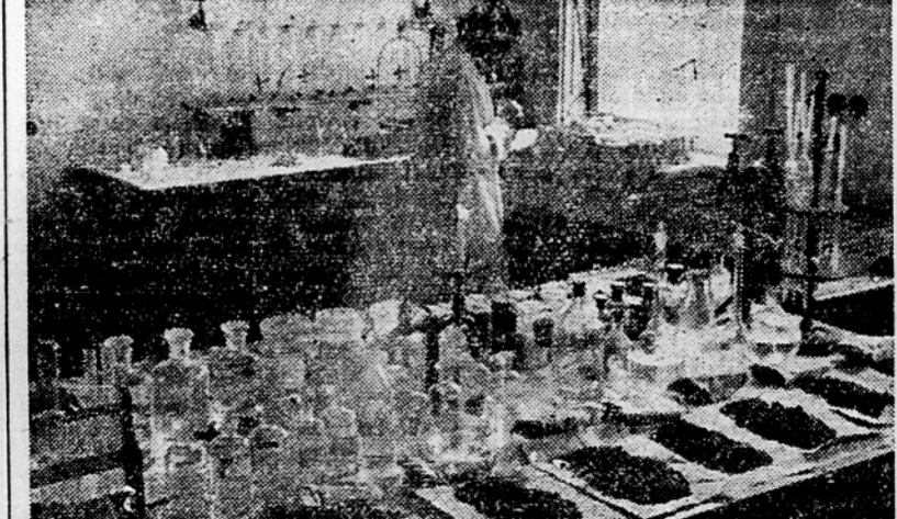
V laboratorijih kmetijskega znanstvenega zavoda preizkušajo naš strokovnjaki svojšiva naše zemlje

sebnou lepji. Začel je razvažati apneno kamenje po vsej njivi. Sprva ni bilo nobene izpremembe. Šele po dveh, treh letih so se začeli pridelki bolj šati. Zdjaj, po petih letih, ko se je apnenec že docela razkrojil, ima kmet krasne uspehe. Toda naša zemlja je polna skrivnosti, ki jih bodo morali pedologi šele odkriti in spoznati. Bili so n. pr. v Zapogah na Gorenjskem. Tam so tla izrazito kisl-