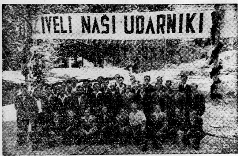
Ob zaključku gradbenih del na hidrocentrali Mariborski otok je bilo proglašeno 41 udarnikov

18 mesecev dela, 18 mesecev borbe z vodnim elementom, 18 mesecev nadčloveških naporov delovnega kolektiva Gradisa — Mariborski otok, je dalo rezultat: