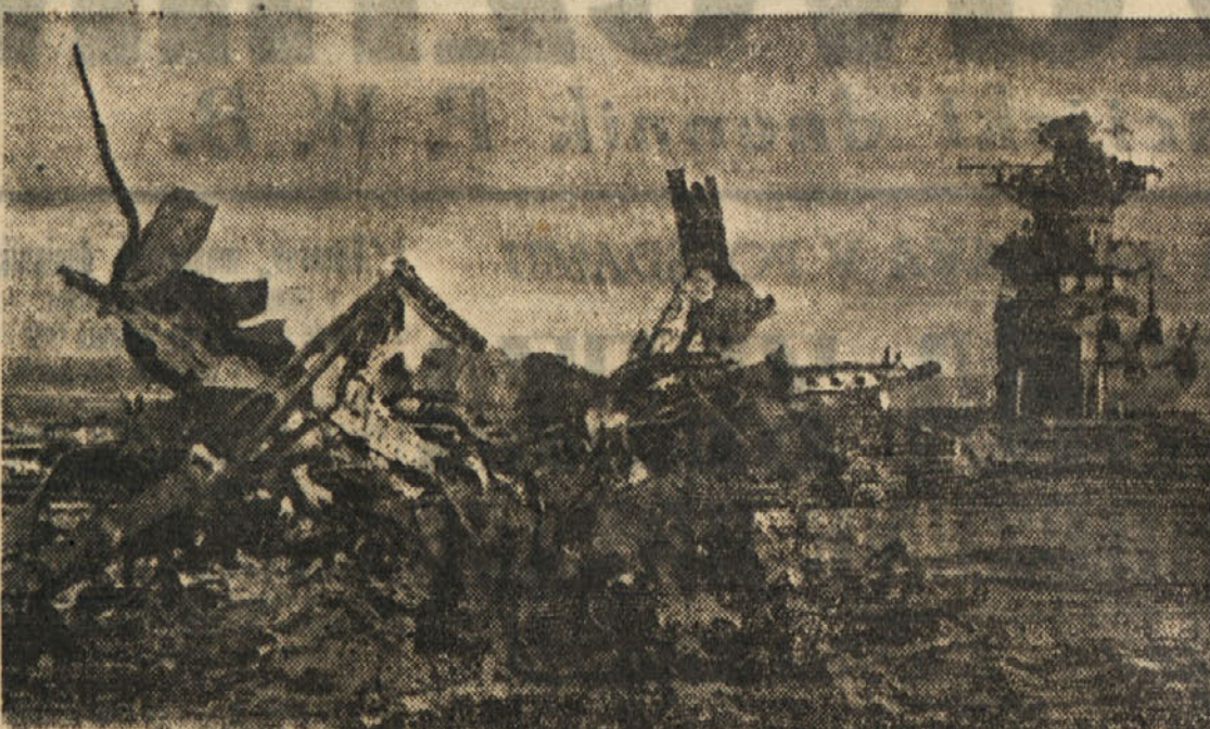
Japonski letalci irtvujejo samega sebe, da bi pridržali zavezniškimi ladjam čim večjo škodo...