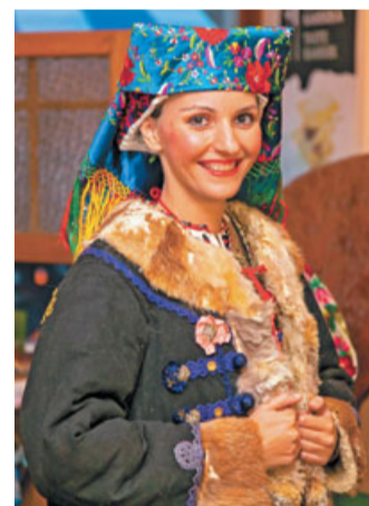
Prava paša za oči je bila revija kostumov in vrhnjih oblačil folklorne skupine Zagreb Markovac.