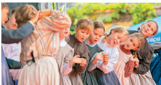
Petkovo popoldne so zaznamovali pristrčni nastopi otroških folklornih skupin iz Moravč in Lukovice.