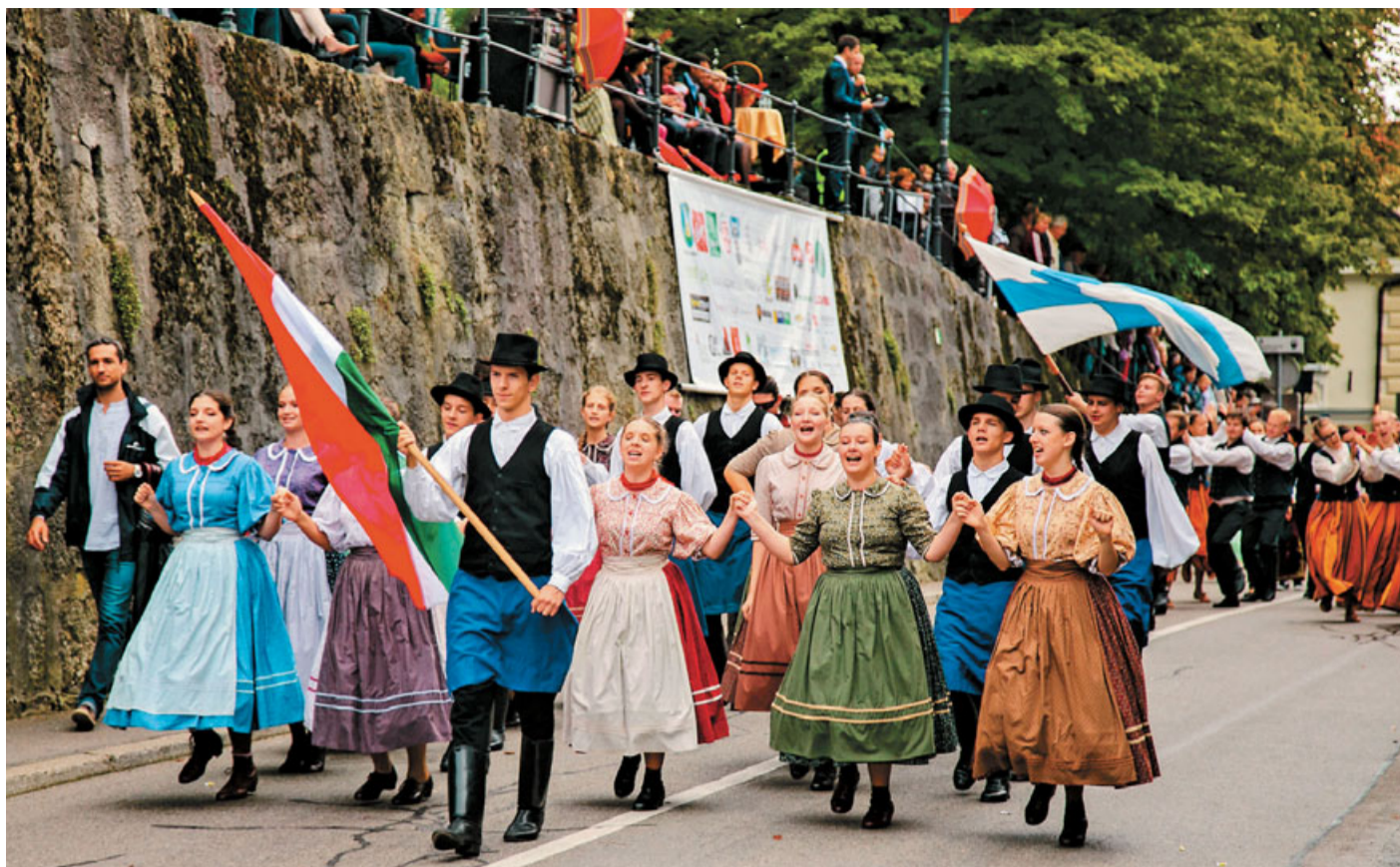
V nedeljski povorki so se med tisoč udeleženci predstavile tudi folklorne skupine iz Izraela, Finske, Bosne in Hercegovine, Madžarske in Italije.