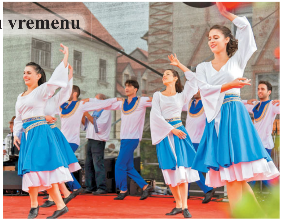
Nastopi folklornih skupin iz tujine vselej pritegnejo veliko pozornosti. Skupina Jerusalem folklore ensemble (Izrael) nam je predstavila izraelsko kulturo skozi mešanico lokalne pesmi in živahnih plesov Bližnjega vzhoda.