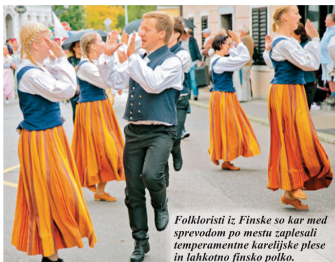
Folkloristi iz Finske so kar med sprevodom po mestu zaplesali temperamentne karelijske plesne in lahkotno finsko polko.