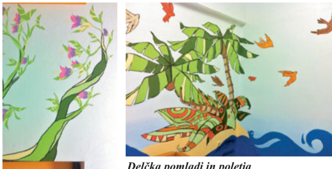
Delčka pomladi in poletja