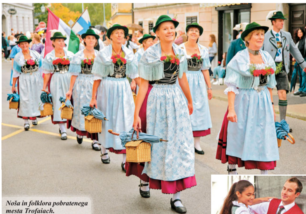
Noša in folklor pobratenega mesta Trofaiaich.