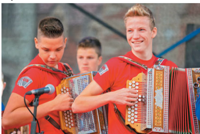
9. tekmovanja harmonikarjev za pokal narodnih noš se je udeležilo kar 31 tekmovalcev, najboljši pa so se predstavili še na glavnem odru.