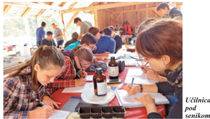
Učilnica pod senikom