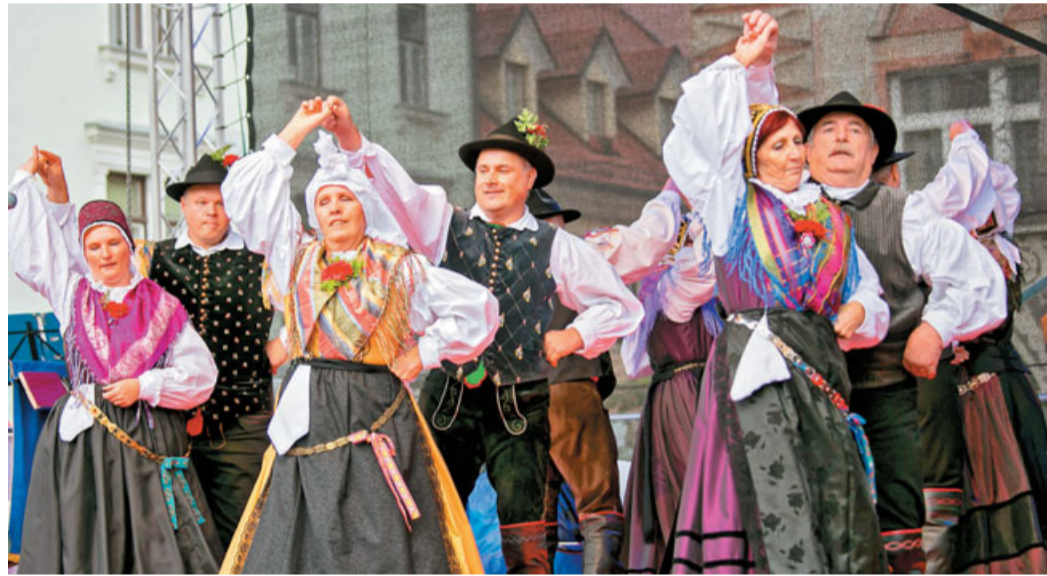
S folklornimi plesi se je tudi tokrat predstavila domača Folklorna skupina Kamnik.