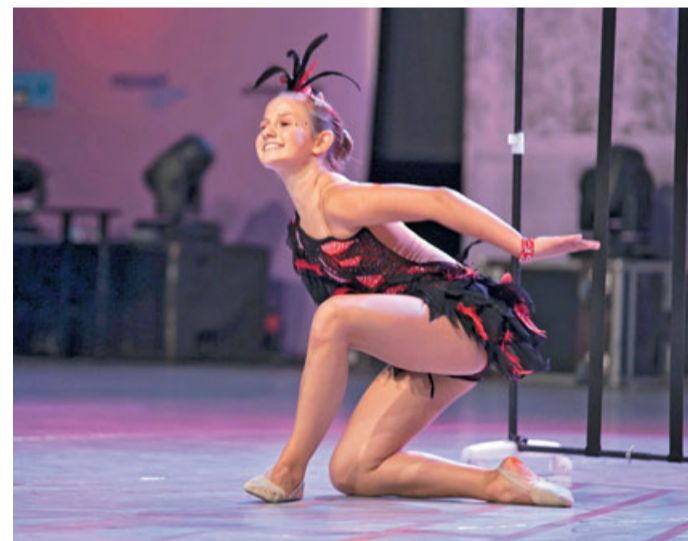
Neli stopa po stopinjah starejše sestre in že osvaja medalje na največjih tekmovanjih.