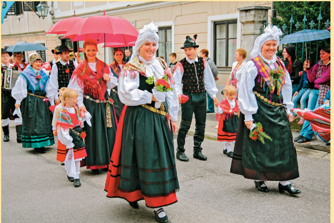
Reportažo o festivalskem dogajanju objavljamo na straneh 2 in 3.