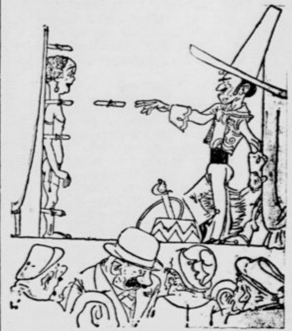
»Poidiva, žena, poidiva, saj vidiš, da ta neroda ne bo zadel z nobenim nožem...« (Judge)