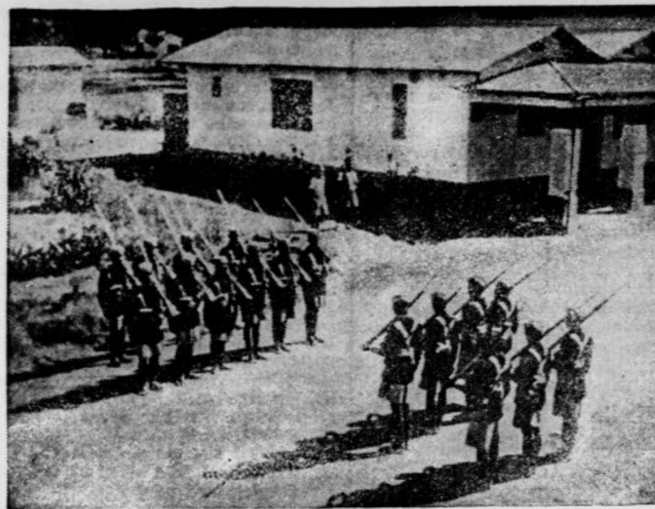
Oddelki angleških askarov na meji Abesinije