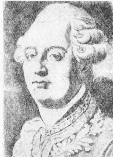
Francoski kralj Ludvik XVI.

Antoine Auguste Parmentier je bil pameten francoski kmet, toda zaman se