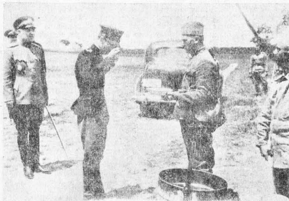
Kralj Peter II. pokušaja hrano na manevrih svoje vojske