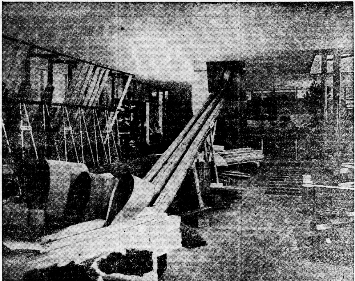
Pogled v jugoslovanski paviljon na velesejmu v Bariju

»Doslje smo odkupili že okrog 16.000 kg oljne repe, sončnic in bučnic. »Setveni plan so vsi kmetje izpolnili