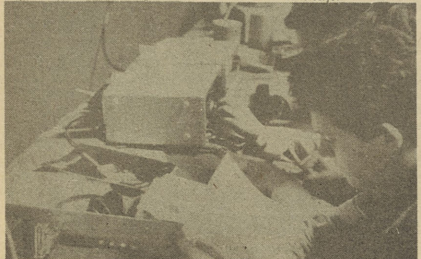
Na zboru so bile vzpostavljene tudi direktne zveze prek postaj UKV in KV področja