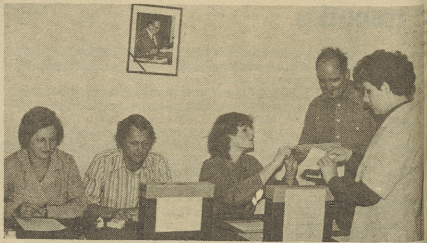
V DO Elektrozveze so v petek, 10. 7. 1980 volili: – delegate v samoupravne organe DS, DO in TOZD – delegate v delegacije skupščin samoupravnih interesnih skupnosti in zbor združenega dela občinskih skupščin. Hkrati so se na referendumu odločili o samoupravnem sporazumu, o stanovanjskih zadevah.

ERO 21. 7.–8. 8. RAČUNALNIKI 23. 7.–8. 8. VEGA 19. 7.–3. 8. MSO 23. 7.–8. 8. ŠTEVCI 23. 7.–8. 8. TEA 23. 7.–8. 8. TEL (Blejska Dobra) 23. 7.–8. 8. ATC 16. 7.–3. 8. MEHANIZMI (Lipnica) 19. 7.–4. 8. STIKALA 23. 7.–6. 8. ORODJARNA 23. 7.–4. 8. MERILNE NAPRAVE 23. 7.–4. 8. VZDRŽEVANJE nima kolektivnega dopusta TOVARNA SESTAVNIH DELOV 19. 7.–3. 8. RAZVOJNO TEHNOLOŠKI CENTER 18. 7.–11. 8. INSTRUMENTI (Otoče) 23. 7.–8. 8. NABAVNA ORGANIZACIJA 16. 7.–3. 8. PRODAJNA ORGANIZACIJA nima kolektivnega dopusta DSSS 18. 7.–11. 8.