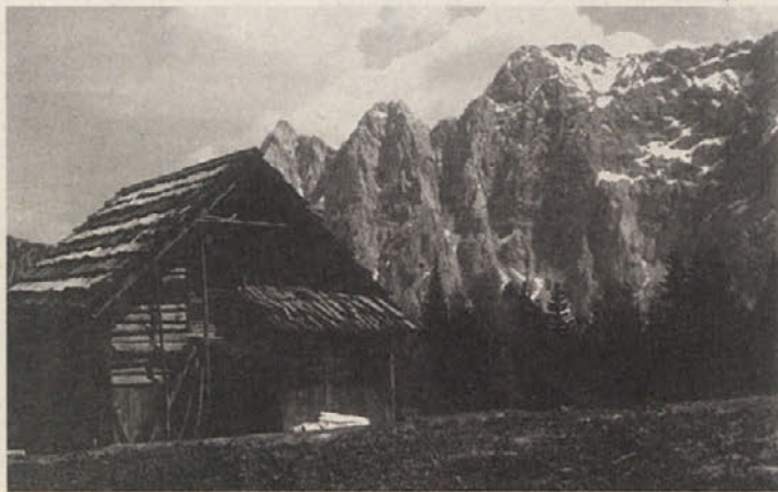
Na Vgrizovi planini

otočki, Ob deževju se na Mlaki tvorijo mala jezerca, na katerih gladini se zrcalijo okoliški vrhovi. No, in če smo že na Mlaki, je skoraj obvezno, da se še podamo na bližnjo Vgrizovo planino (Ogrisalm 1560 m), ki jo dosežemo v eni uri. Steznas z Mlake vodi najprej v smeri proti Sedlu Vrtača (najnižja točka grebena med Vrtačo in Svačico). Po 20 minutah hoje pa nas smerna tabla »Klagenfurterhütte« usmeri na desno vedno lepo navkreber in skozi širok žleb do razpotja – na levo preko Vrat do Celovške koče, na desno pa proti Vgrizovi planini. Mi nadaljujemo na desno. Po par minutah smo pri studencu s koritom, nato pa še nekaj minut po gozdu in že smo na planini s staro pastirsko Vgrizovo kočjo. S planine se nudi lep pogled na rajdo vrha od Grolvca preko Rjavice, Zelenice, Palca, Vrtače, Svačice do plečatega Ovčjega vrha. Čudovita kulisa gora, ki daje Vgrizovi planini pečat z najlepšim razgledom v Karavankah. Pozor, fotoamaterji imate tu lepo izbiro gorskih motivov!