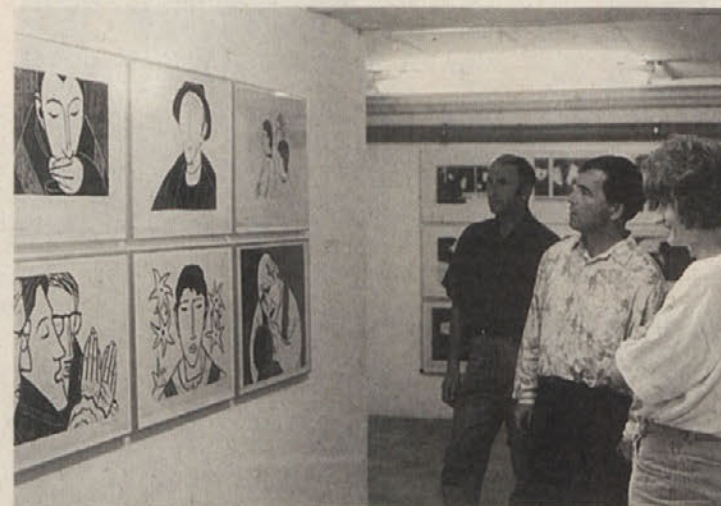
Nekaj sto ljudi je prišlo na otvoritev razstave Bergovih lesorezov

nim izročilom in okoljem, ki sta ga iz roda v rod in zares v potu svojega obraza oblikovala in obdelovala. Berg je vse to ovekovečil po svoje in na najbolj plemenit način: z lesorezi in slikami. Tako je preprečil, da bi lik in podoba tega človeka in njegove duhovne in materialne dediščine in pokrajine zdrknila na raven folkloristično-turistične atrakcije ali pa docela izgignila v pozabi. Iz te življenjske simbioze med Bergom in južnokoroškimi, slovenskimi, ljudmi so nastajale edinstvene človeške podobe in slike okolja. Včasih se zdi, ko da je edinole Berg znal ohraniti in primerno verodostojno dokumentirati podobo takratnega časa in njegovih ljudi, in vdahniti duha trajnosti in neokrnje-