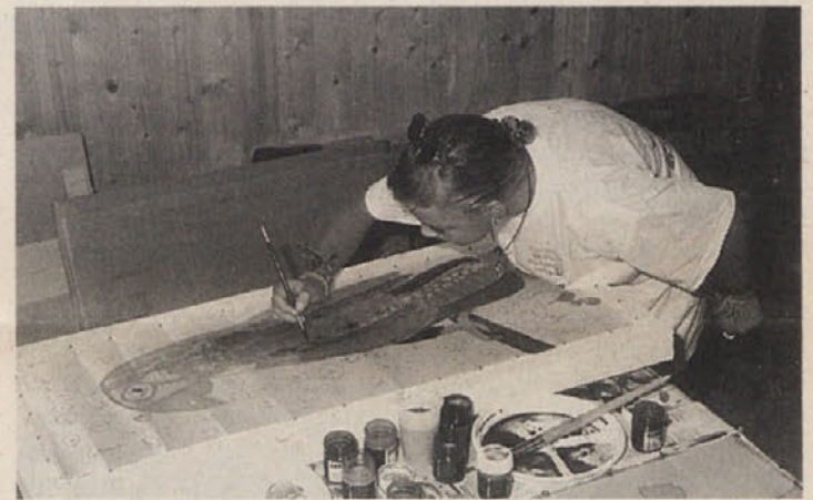
Nič je ne more zmotiti, tako je zaverovana v svoje delo

Šentjakobu v Rožu. Prostorni farovž je nudil dovolj prostora za vse potrebe ustvarjalne mla-