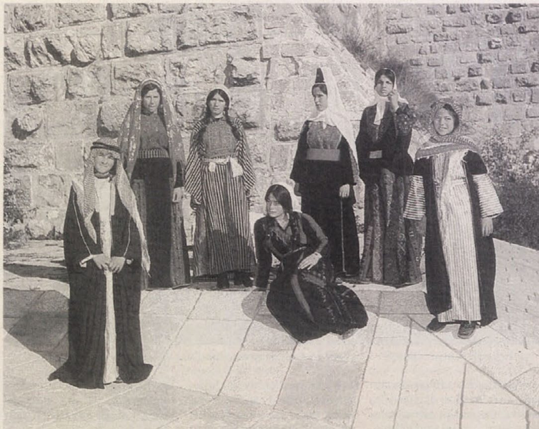
Mladina različnih narodnostih in ver išče pot trajnega miru

V sredo, 9. avgusta, se je vse začelo. S sprejemom delegacij na letališču Wien Schwechat se je spet vnelo prijateljstvo, ki traja že več kot eno leto. Hvalabogu tokrat niso bila prisotna javna občila, ki bi spet postavljala neumestna vprašanja in s tem samo kvarila naše razpoloženje. Tokrat smo bili sami, tako rekoč nemoteni, da bi se čim bolj razumeli in seveda tudi izdelali načrte za prihodnost in tako čim več prispevali k izraelsko-palestinskemu »prijateljstvu«. Morda se boste čudili, da sem prijateljstvo med tema dvema narodoma postavil pod narekovaj. Neka palestinska deklica mi je rekla sledeče: »Nihče ne more pričakovati, da se bomo z Izraelci kdaj zblížali in da si bomo rekli prijatelji. Zakaj? Kako morem nekemu