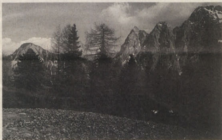
Pogled v obzidje Karavank z Mlake