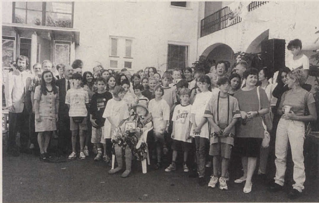
Za konec likovne kolonije v Šentjakobu v Rožu pa še skupinska slika vseh udeležencev in gostov

Kmalu je kolonija prekoračila koroški okvir in je pod svoje