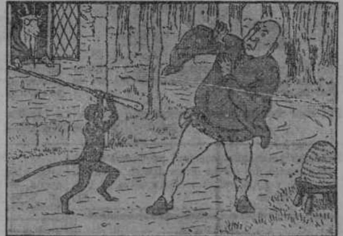
32. Opica Kiki napade orjaka.

Opica Kiki naglo skoči z drevesa in brzi proti koči kože Modre. Orjak jo je podil do vrat. »Hitro! Hitro! Hrabra Kiki!«, reče koza, odpre vrata in jih naglo zapre. »Sedaj bo nam lažje, ker imamo čarovno palico.«