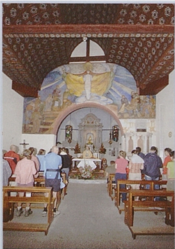
Spodaj: drugi višarski dnevi mladih (2009).

Dokaz, da je bilo druženje zelo prijetno in koristno, je predvsem ta, da smo od takrat skupaj