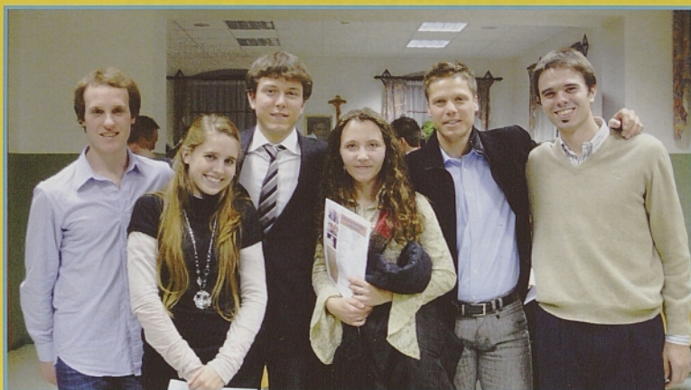
Na slikah so posnetki z ljubljanskega srečanja s slovensko mladino iz Argentine.

Čas je, da se mlajše generacije поблиže spoznamo s Slovenci po svetu. To je pravi čas zato, ker imamo zdaj internet in podobne pripomočke, ki nam to omogočajo. Zdaj je pravi čas tudi zato, ker so druga svetovna vojna, povojni