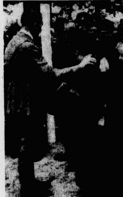
Adolf Hitler richtet an die Hinterbliebenen Worte herzlichen Trostes.