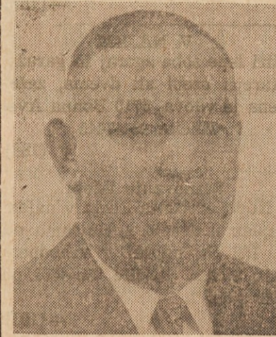
V BLAG SPOMIN

ČETIRTE OBLETNICE ODKAR NAS JE ZAPUSTIL NAS LJUBLJENI STRIC IN BRAT