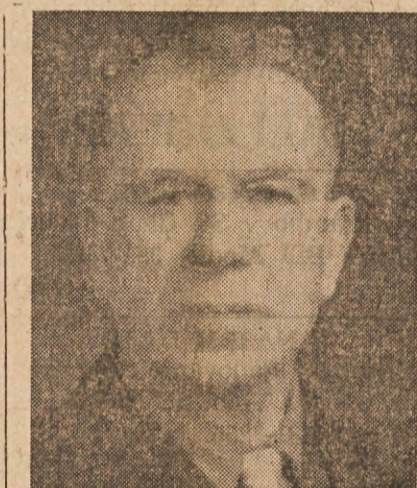
V BLAG SPOMIN

in njenega vračenja nekaako bal. Ovca je segla v svojo prečudno pisano torbo in potegnila iz nje na surovo udelan dihurjev meh. Na spodnjem koncu je še vedno kazala glava malega roparja ostre bele zobe. Zavezan pa je bil meh z zadnjima nogama, katerih so se tudi še držali krepeljci. Vdova Tršatega Tura je odvezala skrivnostno bisagico, pričela jemati iz nje svoja vračila in jih razlagati na rob ognjišča. Izmed njih je odbrala dolgo in tenko in voljno črno koreniko in jo zavezala Somu okrog zapestja neokretnih roke. Na razgaljene, osivelo kosmate prsi mu je natresla iz