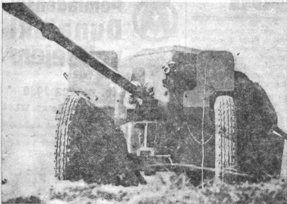
Spodaj: Protitankovske ovirne pred francosko Maginotovo črto. — Levo: Top proti tankom na francoskem bojišču