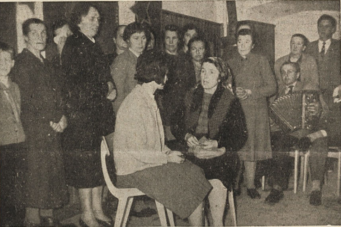
Med proslavo dneva žena v Ortneku