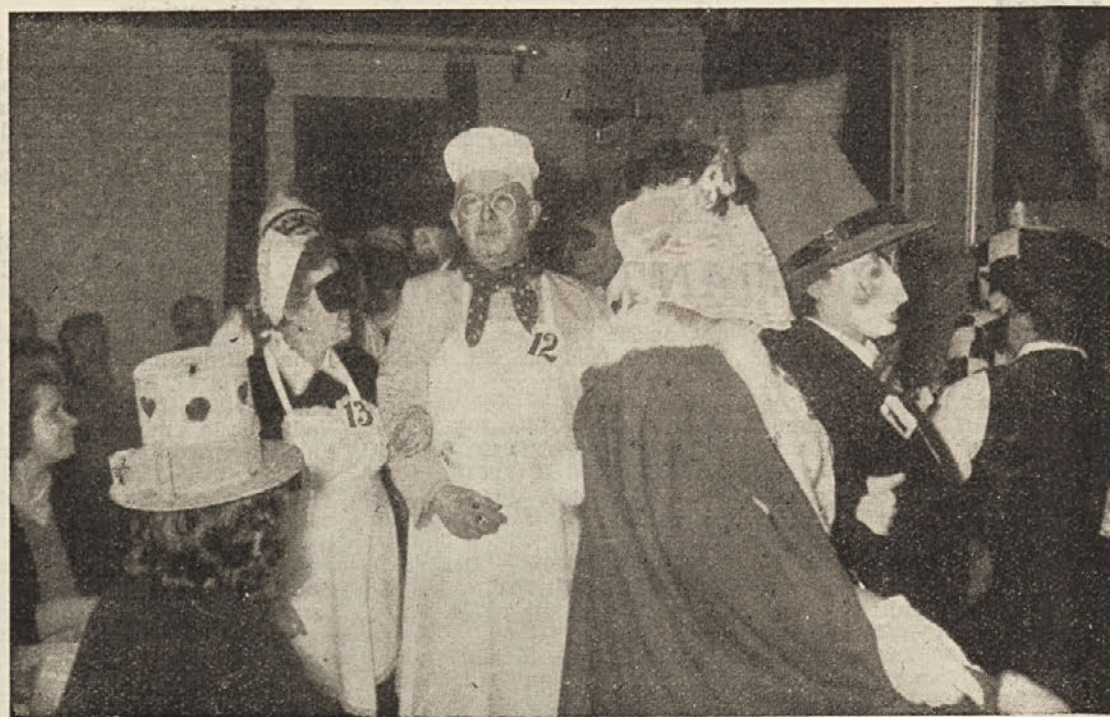
S pustovanja kočevskih upokojencev