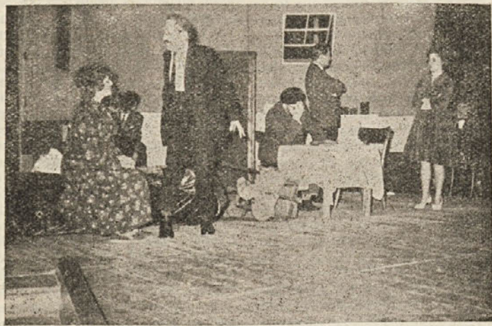
Prizor iz komedije Poročil se bom s svojo ženo

Scena je bila sorazmerna, edino je motila prerazkošna razsvetljava v podstrešni sobici. Zelja vseh je, da bi se ta an-