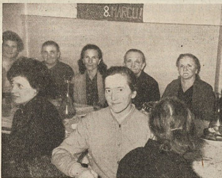
Žene iz Klinje vasi in Zeljn praznujejo

Po proslavi se je zbralo veliko število žena in moških v hotelu Pugled, kjer so se veselo razpoloženi zabavali pozno v noč. Družabno življenje v naši družbi ne more biti samo privilegij moških, kot je bilo to v starih časih, ko so moški jemali v družabno življenje ženske samo za svojo zabavo. Danes ženske tudi v tem nastopajo kot enakopravni činitelji, brez predsodkov in licemerstva starih naukov o družbeni in moralni vlogi žensk. Puhla malomeščanska teorija o ženski enakopravnosti izginja, ker jo realna dejstva resnične enakopravnosti žena odpravljajo v celoti. Po načelih stare družbe žene same niso smele na zabavne prireditve, niso smele plačati zapitka v moški družbi. Če so to storile so bile predmet zasmejanja s priimkom cipe. Danes je to že normalno, da tudi po tem vprašanju nastopajo ženske enakopravno in nihče več se glede tega ne posmehuje in ne ob-