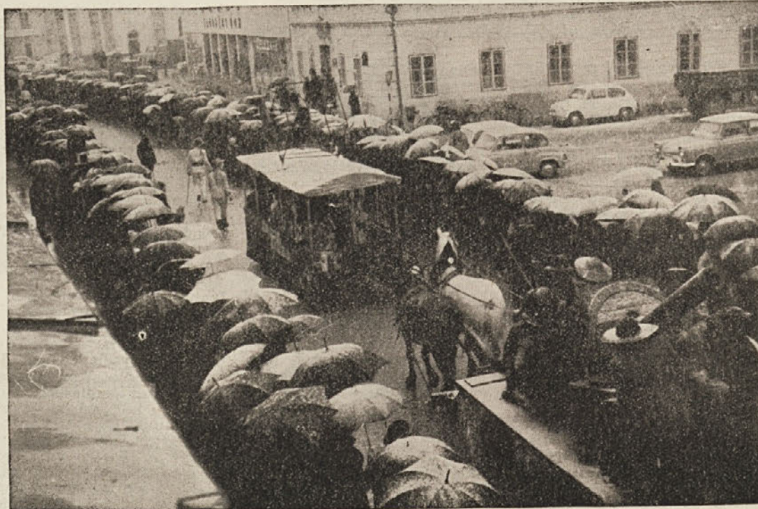
Pustni spredov v Ribnici: Top, s katerim so Ribničani obstreljevali Kočevje