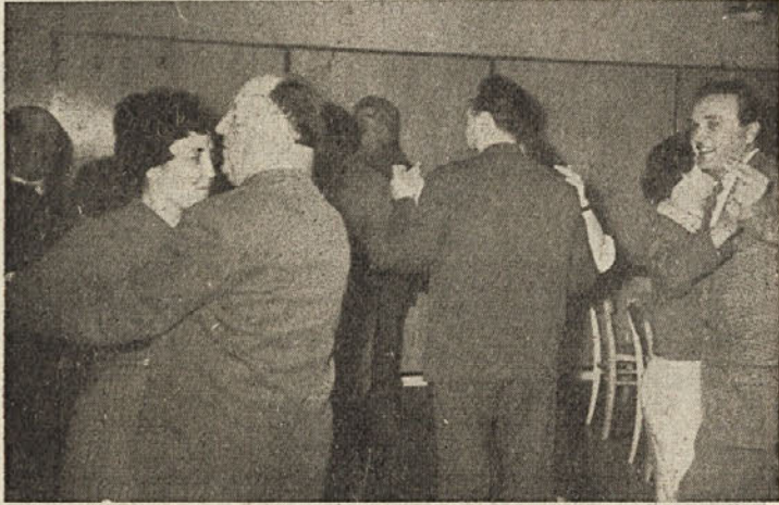
Med praznovanjem v Rudarskem domu

je bila zelo dobra in ni manjkalo dobrega razpoloženja in humorja. Ob zvokih harmonike se je razvila prijetna zabava v veselo rajanje. Tudi za prigrizek se bilo poskrbljeno in tako so se tudi vaščani v Črnem potoku na praznik naših žensk razvese-