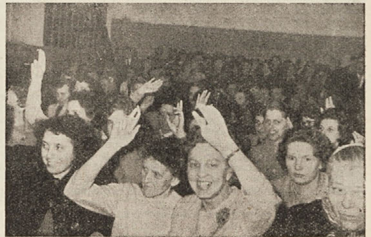
Delavke glasujejo na občnem zboru v Tekstilani

zaposljevanju invalidov, izobraževanju, borbi proti alkoholizmu in drugim. Vse premalo pa so invalidi razpravljali o decentralizaciji varstva borcev in invalidov, o kadru, ki bo zaradi decentralizacije potreben, o povezavi invalidske organizacije s kadrovski socialnimi službami po podjetjih in o sredstvih, ki jih bo potrebovala decentralizirana služba (in v zvezi s tem če ne bi morda kazalo ustanoviti v komuni sklad za finansiranje socialnega varstva, oziroma če so sploh pogoji in možnosti za njegovo ustanovitev). Omeniti bi bilo morda še potrebno, da so (kot je običaj tudi na drugih konferencah, sestankih, sejah in podobno) govorili največ moški, ženske pa so v glavnem le ploskale.