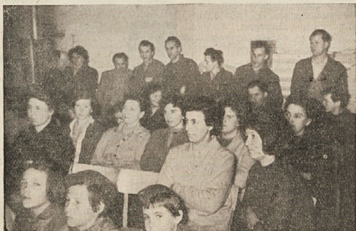
Tudi v ČZP »Kočevski tisk« so proslavili dan žena

Žene iz Crnega potoka pri Kočevju so organizirale lepo uspešno družabno večer v gostinskem lokalu pri Malnarju. Udeležba (Nadaljevanje na 4. strani)