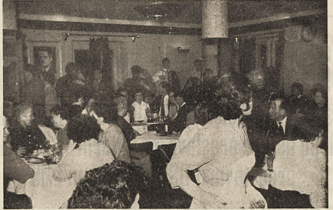
Po proslavi zabava v hotelu Pugled

Da pa žene na Vimolju ne bi bile prikrajšane, posebno ženo interniranka, ki je stara 66 let, so zaradi nje in zaradi tistih,