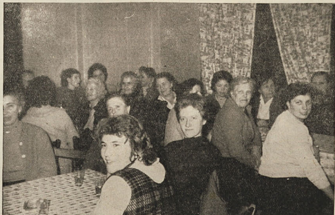
Žene iz Salke vasi in Zeljn na proslavi 8. marca

V Klinji vasi je SZDL organizirala za žene iz Klinje vasi in Zeljn lepo uspešno prireditev. Program so dopolnili pionirji, za