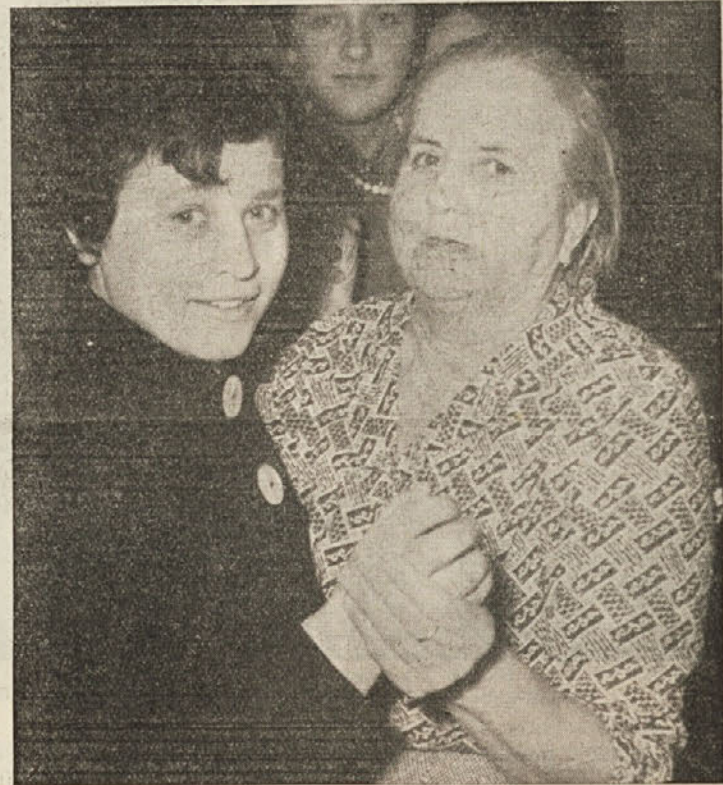
Tudi Knavsova mama iz Zeljn se je zavrtela

Naša ženska na vasi, ki je bila v preteklosti še bolj zatirana, kot ženske po mestih in industrijskih središčih, je danes odvrгла spono in vezi, ki so jo držale v tisočletni podrejenosti in živi svobodno kot človek.