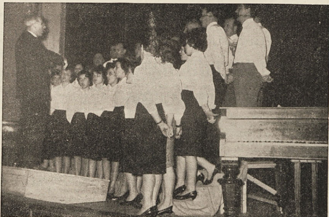
Na proslavi dneva žena v Šeškovem domu je nastopil pevski zbor »Jakob Galus«

TUDI VI POMAGAJTE REŠEVATI ŽIVLJENJA IN SE PRIGLASITE DA BOSTE DALI KRI!