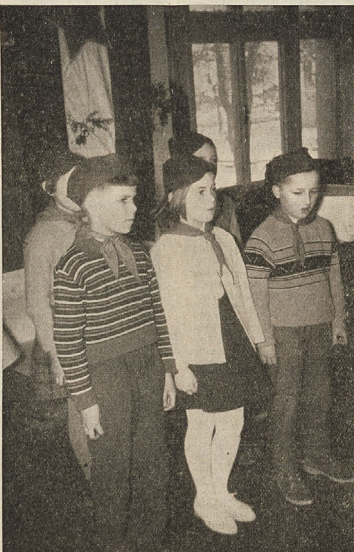
Pionirji recitirajo ženam v ČZP »Kočevski tisk«

Člani UO — KZ in obč. odbora SZDL iz Ribnice so se v počastitev 8. marca spomnili tudi