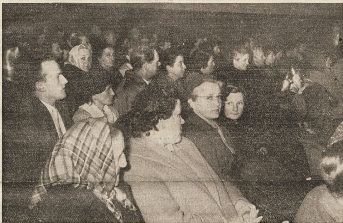
Občinstvo na proslavi 8. marca v Seškovem domu

Po končani proslavi so imeli tudi zabavo. Ženske so same