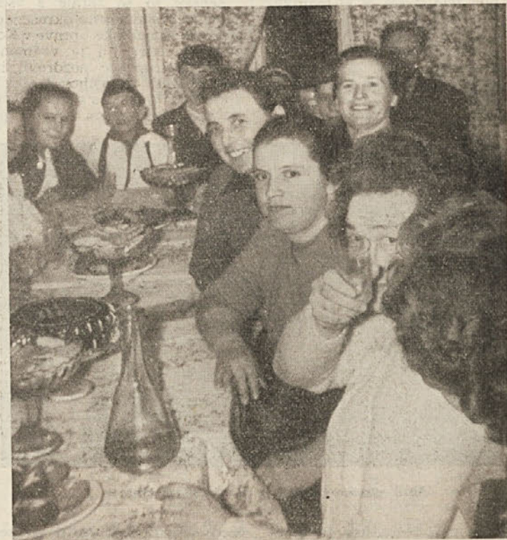
Zabava žena v Klinji vasi

Vsem ženskam iz Salke vasi, ki so se prireditve udeležile, bo ostala v najlepšem spominu in to jim bo v še večjo vzpodbudo za nadaljnje delo.