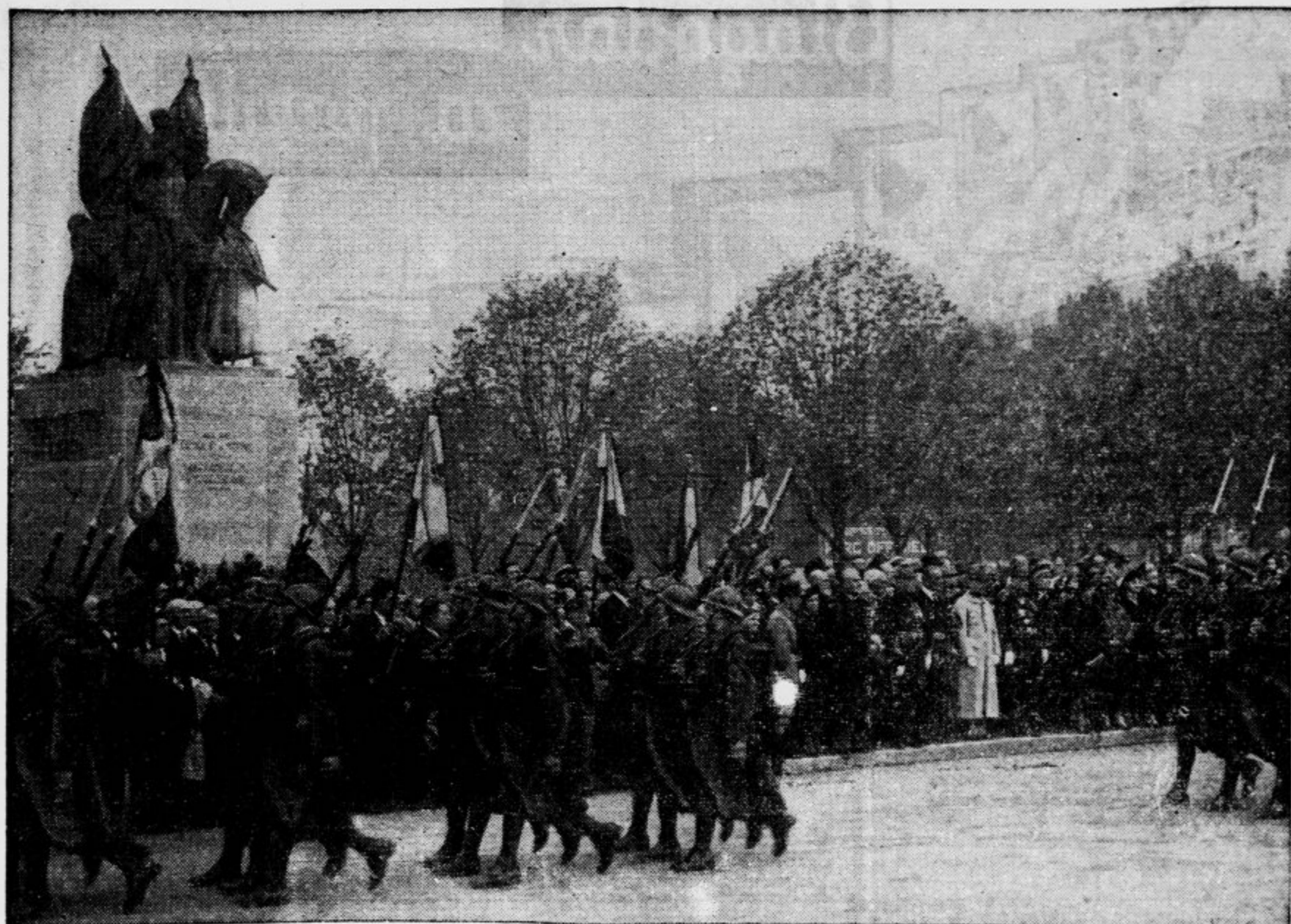
Na letošnjo obletnico marsejske tragedije so francoske čete defilirale pred spomenikom kralja Petra Osvoboditelja in Aleksandra na trgu Muette v Parizu. Vojaški proslavi je prisostvovalo tudi mnogo civilnega prebivalstva