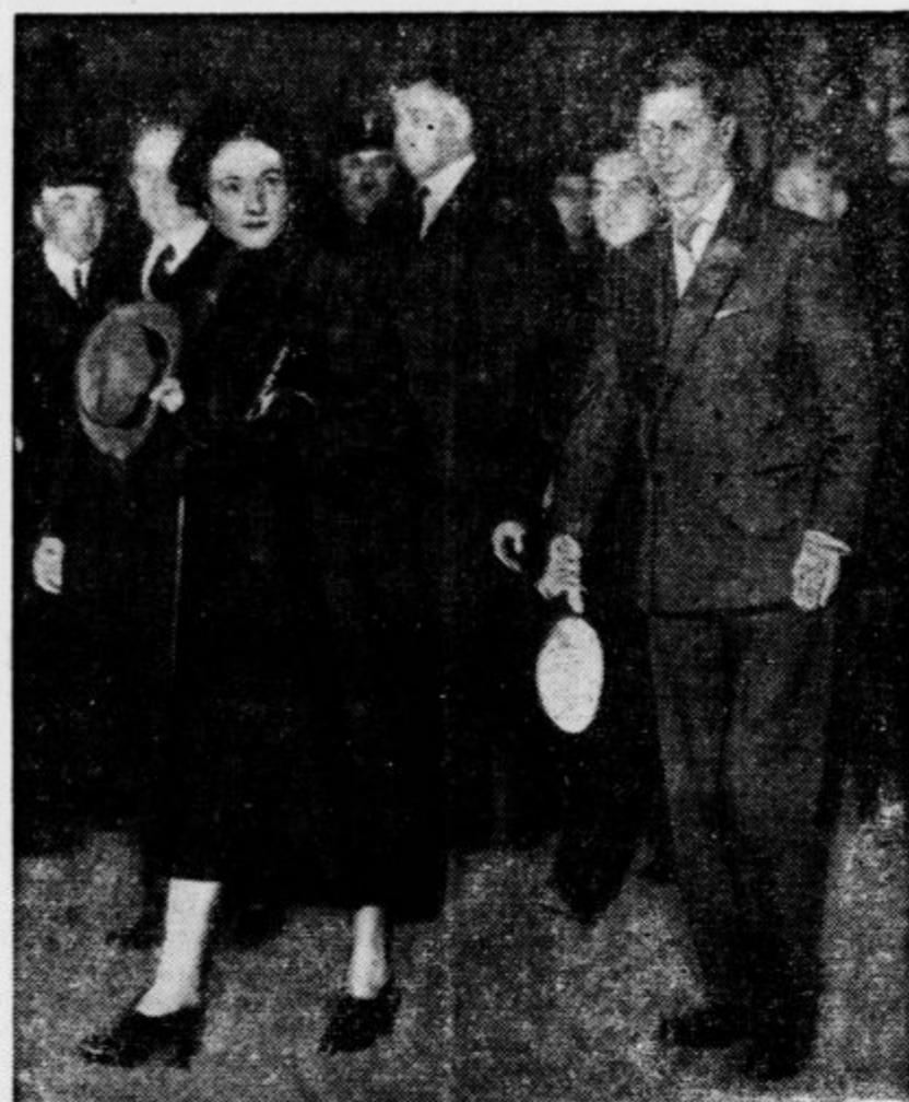
Vojvoda Windsorski s soprogo pri odhodu iz Pariza