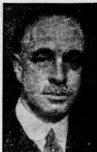
Angleški poslanik pri rimski vladi, lord Perth