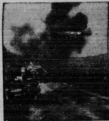
Tanki si utirajo pot.