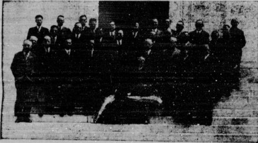
Slovenski župani na Oplencu.