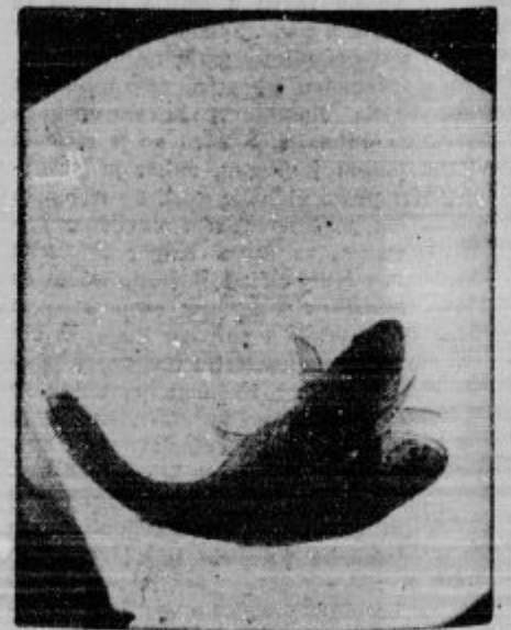
Posrv z dvema glavama, kakršna je zagledala luč sveta v ribogojnem zavodu v Yosemite v Kaliforniji.