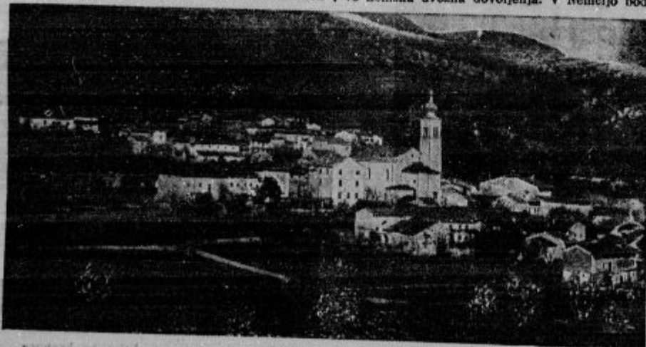
Črniče na Vipavskem z dekanijsko cerkvijo

Po najnovejših računih stane državo angleška vojska okrog 3 milijarde funtov ali 600 milijard dinarjev.