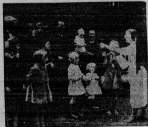
V Franciji sprejemajo belgijske begunce