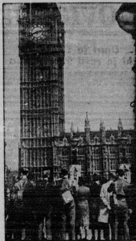
Londonski prebivalci pred Westminsterko palačo pričakujejo poročila z bojišča.