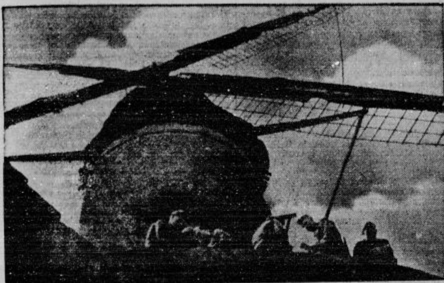
Značilni nizozemski mlin na veter, okrog katerega počivajo vojaki.