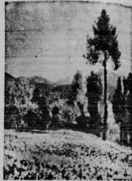
Pogled na narcisne poljane na Golici.