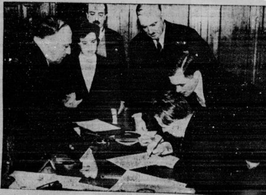
Sovjetski poslanik Lavrentijev podpisuje trgovsko pogodbo, katera je bila nedavno sklenjena med Jugoslavijo in Sovjetsko Rusijo.