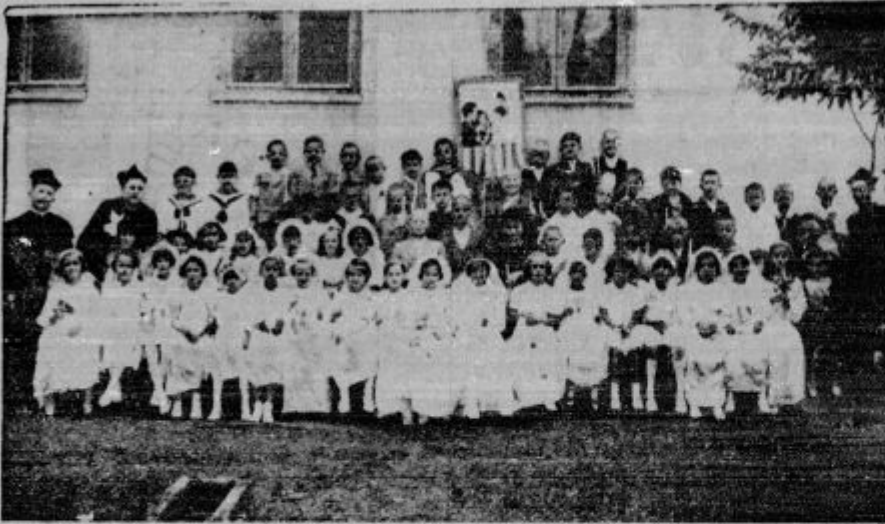
Prvo sveto obhajilo v Skoplju dne 19. maja 1940.