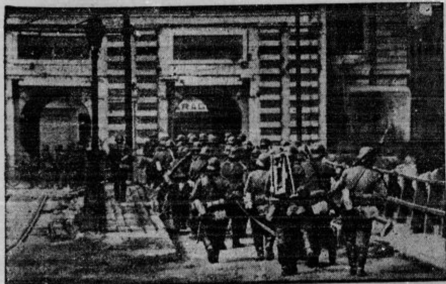
Nemške čete korakajo v francosko trdajavo Maubenge, ki so jo zavzele po hudem boju.