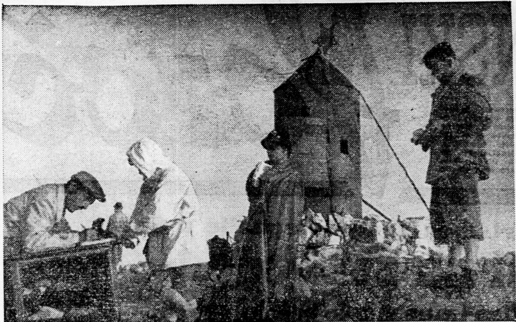
Turistična sezona je na višku. Vrhovi naših gora imajo letos dobro oskrbovane planinske postojanke, v veliki meri nosijo zasluge, da je dook ljubiteljev gora tako velik. Vse priznanje zasluži Planinska zveza Slovenije s svojimi društvi, posebno pa P. D. Ljubljana-matica, ki ima v oskrbi naše vrhunske postojanke: Kredarico, Kočo pri Sedmerih jezerih in Komno. — Silka kaže vrh Triglava v zoodnjih juranjih urah, ko že mlado in staro uživa v širnem razgledu. Tudi vpisa v spominsko knjigo na najvišji točki naše domovine nihče ne pozabi.

3. če se bo perzijska vlada strinjala s prvima dvema točkama, bodo predstavniki anglo-iranske družbe našli praktičen način za odvajanje petroleja, ki je sedaj v perzijskih skladiščih. Hkrati bo britanska vlada ukinila embargo na šerlinskih imovino Perzije, vtem ko bo ameriška vlada ponudila perzijski vladi 10 milijonov dolarjev kot pomoč za prehoditev sedanjih proračunskih težav Perzije.