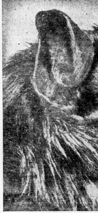
Netopir Desmodus rotundus

popolno uničenje teh netopirjev — vampirjev. Nedavno so poslali specialne čete, ki odkrivajo vsa brezdana in votline, naseljene z vampirji, in jih s plinom uničujejo. Slično uničevalno vojno bodo na priporočilo zdravstvenih organov začeli izvajati tudi na Trinidadu.