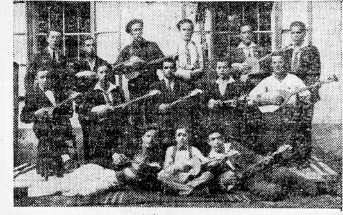
Tamburaški zbor v Litiji leta 1925

ska zastopnika v občinskem svetu. V »Svobodo« je vstopalo vedno več ljudi. Posamezni odseki so se zelo krepili in napredovali, najbolj pa tamburaški zbor, ki je vsako leto 1. maja z budnico oznanjal ljudem začetek delavskega praznika. Lado Gajšek.