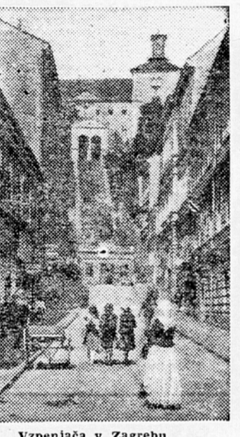
Vzpenjača v Zagrebu

20 milijonov dinarjev). Njen obrat bi bil enostaven in poceni. Njena rentabilnosta bi bila zagotovljena, od prvega začetka obratovanja, njen obstoj pa