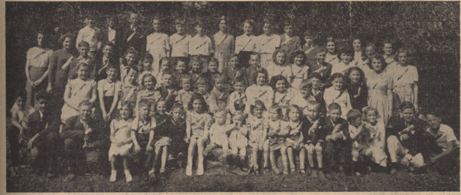
Mladinski odelek odseka VPZ. Bled št. 12 "Novo Mesto v St. Catharines, Ont.