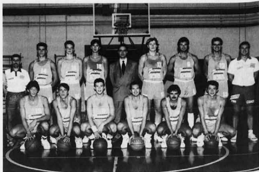
Igralci Jadrana, naše najboljše slovenske košarkarske ekipe v zamejstvu

PRODAJALNA TRST - UL. S. CILINO 38 TEL. 040-54390