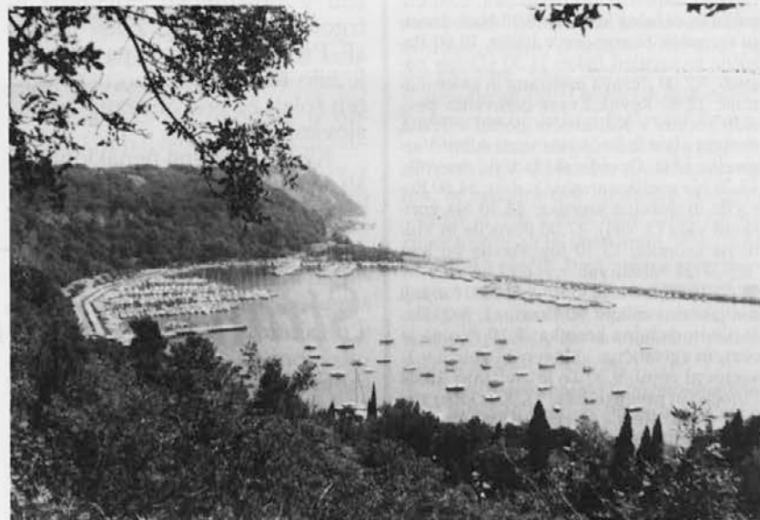
Pogled na Sesljski zaliv

Kako se bo zadeva razpletla, bo mogoče precej znano že konec tega meseca. Za 30. oktober je namreč sklicana seja, na kateri naj bi se komisija pri ministrstvu za okolje končno izrekla.