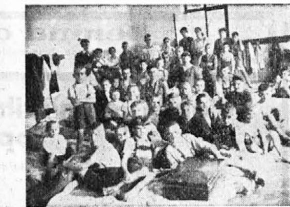
Jeseniški otroci na počitnicah v Dolenjskih Toplicah. — Po veliki večini so to otroci delavskih staršev

Nemci so pokazali — nadaljuje svoja izva-janja omenjeni sovjetski letalski general — čisto nov način, kako se v sodobnem vojskovanju uporabljajo letala, tanki, motorizirani oddelki, kako se pošiljajo transporti vojaštva in vojnega materiala in kako se je treba posluževati radia in padalcev. Bliskovita naglica, s katero so bile izvedene nemške vojaške operacije, sovražniku ni dala časa, da bi mogel pravilno oceniti položaj in da bi se odločil tako, kakor bi bilo potrebno. Nemško prodiranje je dokazalo, kako pravilno je bilo, da so prevzajali čete po zraku in jih tudi po zraku preskrbovali z vsem, kar pri vojskovanju potrebujejo. To bi se lahko imenovalo »navpična obkolitev« sovražnika ali »obkolitev od zgoraj«. Ta navpična obkolitev je na ta način postalo dejstvo in je bila uspešna celo v tistih krajih, ki so zelo