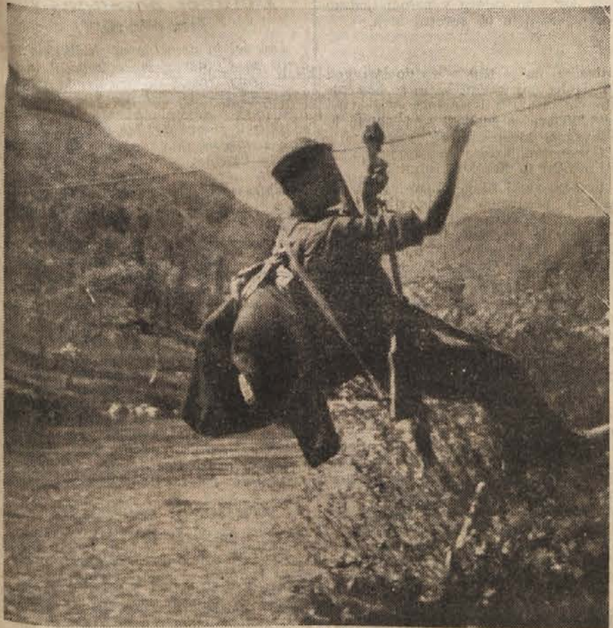
Prehod borcev preko reke.