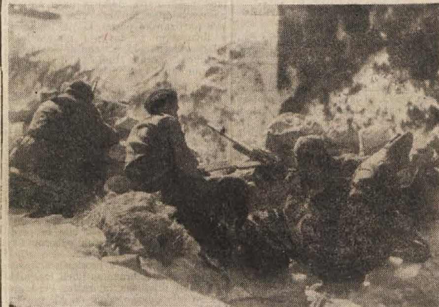
Izvidnica na položaju.

Torišče operacij I. brigade je bilo obsežno ozemlje Dolenjske, II. brigada je razmestila svoje sile po Primorskem in Gorenjskem, III. brigada pa na Štajerskem in Koroškem. Povsodi, kjer so se pokazale kraljice protinarodnega delovanja različnih izkoreninjenec, so uspešno nastopile proti vsem, ki so hoteli nastopiti proti narodno osvobodilnemu gibanju v najrazličnejših oblikah.