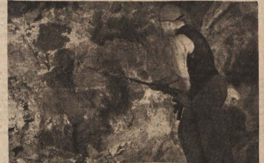
Da bi prišli do novih plasti rude, vrtajo rudarji z vrtalnimi stroji stene, ki jih nato razstreljujejo.

Mežiški rudarji so se odzvali pozivu na prvomajsko tekmovanje svojih delovnih tovarišev iz rudnika Trepče. Izdelali so si podroben tekmovalni načrt, tako v dvigu proizvodnje kakor v izboljšanju produktov, v delovni disciplini in v kulturno prosvetnem delu. V tekmovanju vlagajo mežiški rudarji vse svoje moči in sposobnosti, da tekmovalni načrt ne samo dosežejo, marveč prekoračijo in s tem pripomorejo naši domovini do čim hitrejšega gospodarske obnove.