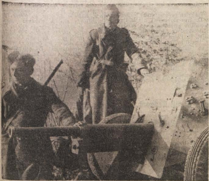
Divizijski top na položaju.

Nedičevsko-mihajlovičevske tolpe so doživele hude poraze v Srbiji, pa so se pričele umikati proti severnim predelom Jugoslavije, da bi navezale stike s slovenskimi izdajalci in si tako podaljšale življenje. Izkazalo se je, da ob razstresenosti VOS-ovskih grup ni bilo mogoče enotno voditi vseh teh enot; potrebno je bilo vnesti med stare prekaljene boje enotno vodstvo, enoten vojaški duh in enotno organizirano disciplino. Iz teh razlogov se je VOS preobrazil v Vojsko državne varnosti, ki je prevzela dediščino VOS-a s ponosom in trdno voljo, da nadaljuje započeto delo s še večjo uspešnostjo. Divizija VDV je pozneje prišla v sestav korpusa narodne obrambe Jugoslavije kot II. divizija s tremi brigadami.