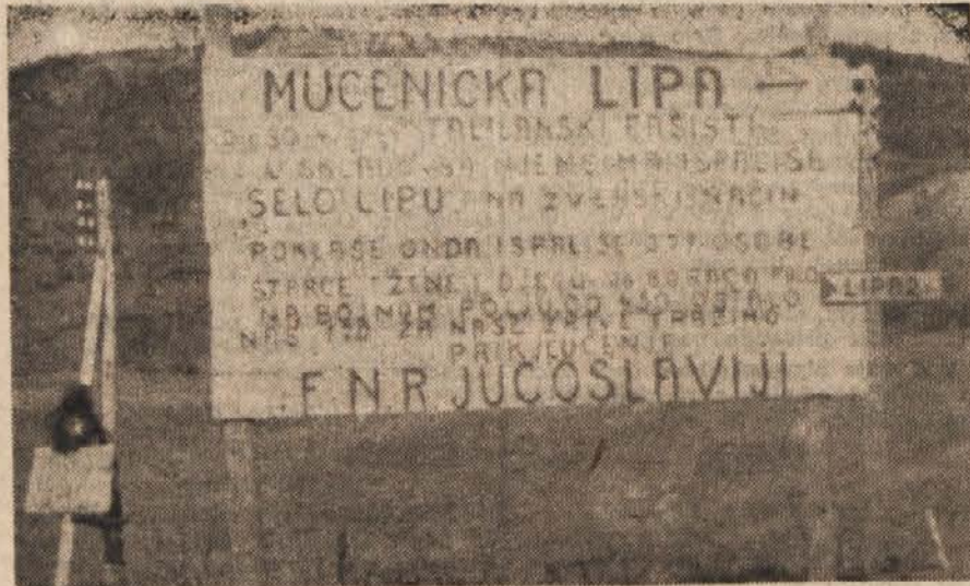
Pred vasjo Lipo, kjer so Nemci poklali in nato zažgali 217 ljudi, je tabla, na katero so prebivalci napisali vse svoje žrtve.

Vračali smo se. Bila je že noč. Na Bazovici smo zvedeli, da je bil popoldne na Škrednjem pokolj. Kdo je kdaj streljal z mitraljezi na naše ljudi: v naše žene, v naše otroke, v našo mladino? Pojdite v mučeniško Lipo. Tam vam 170 preživelih pove, da so bili to vselej njihovi smrtni sovražniki: Nemci, italijanski fašisti ter ustaški in četniški koljači. Iz B.