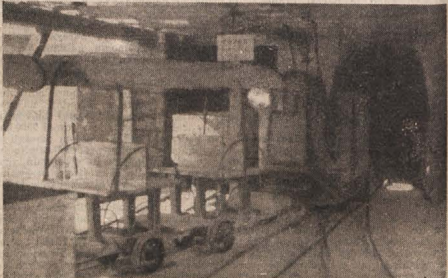
V majhnih vozičkih vozi električna lokomotiva rudarje na delo.

Vso rudo izvoziijo iz jame po glavnem izvoznem rovu, ki pride na dan v Žerjavu. Tu jo stresajo v bunker, nato pa jo vozijo žične železnice prepeljejo na vrh izbiralnice, jalovino pa na izspališče. V izbiralnici ločijo rudo od jalovine. Zraščeno rudo drobijo v željstunem drobilcu in valjastih mlinih ter jo nato ločijo v ločilnih strojih in na stresalnih splavih, kjer se sortirajo jalovina, svinco in cink. V oddelku za flotacijo izločijo čisto svinčeno in čisto cinkovo rudo v najfinejših delcih