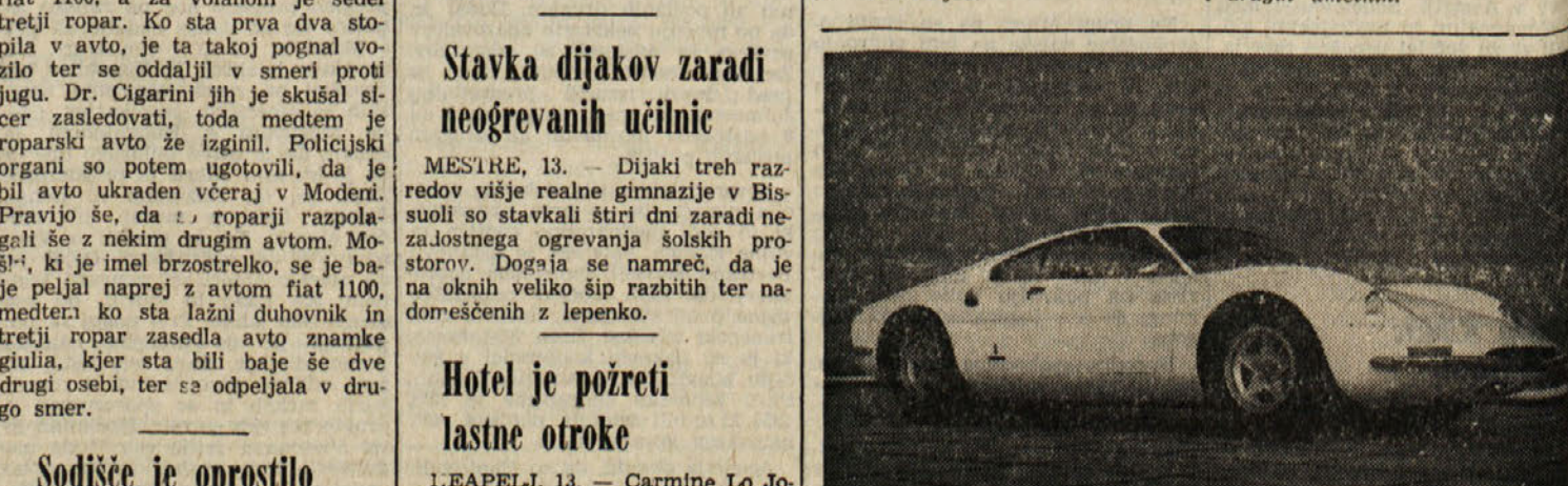
Podjetje Pininfarina še vedno preseneča javnost s svojimi izredno aerodinamičnimi karoserijami. Na sliki: posebna tridesetna «berlineta» z volanom v sredini