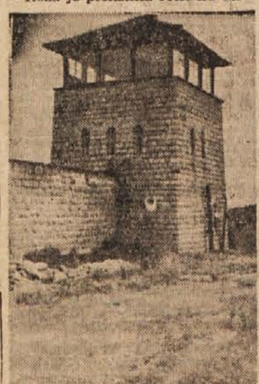
Stražni stolp v taborišču Mauthausen