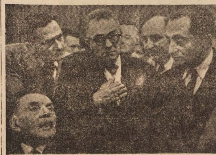
Na zadnjem kongresu francoskih radikalnih socialistov je stari voditelj Herriot (na sliki sedeč) pripomogel Pierru Mendès-Franco do velikega političnega uspeha

hidroenergetskih virov (kakih 60 milijard kWh letno), je izkoriščala doslej samo nekaj odstotkov te zmogljivosti, vsem ko so sedanjde dežele Italija, Avstrija in Zahodna Nemčija malone do kraja izkoristile svoje energetske vire.