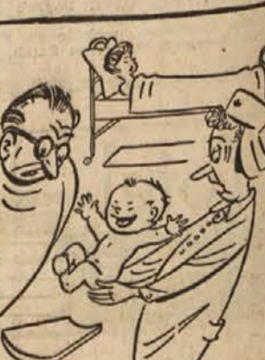
»Počutim se, ko da sem na novo rojen.«