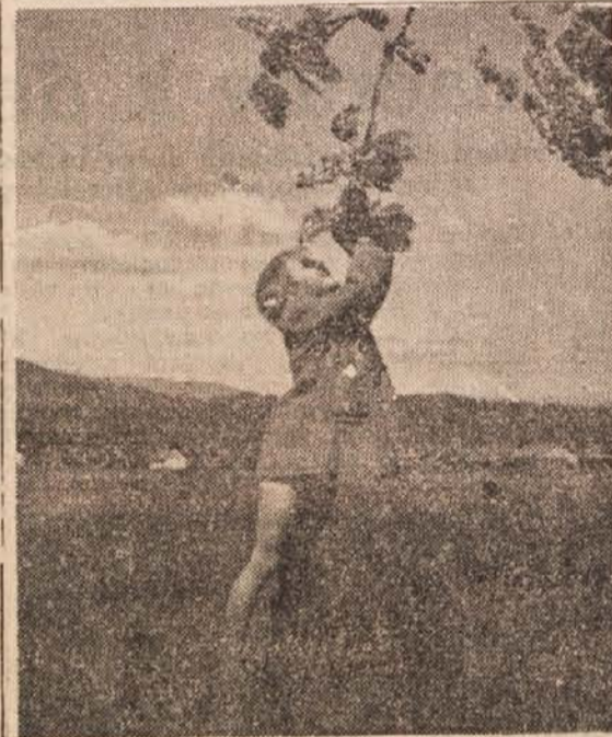
Samo en evet bi čada utrgala s kote krošnjo divjega kostanja

Tovarna olja v Zagrebu je naprosila Narodno banko FNRJ, naj ji odobri olajšave za uvoz opreme za proizvodnjo margarine. Naprave bi sicer stale kakih 35.000 dolarjev, toda tovarna bi izdelala letno kakih 1500 ton margarine, tako da bi prihranili 220.000 dolarjev pri uvozu.