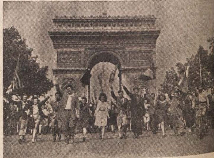
V Parizu so 8. maja slovesno proslavili dan osvoboditve. Na 12 dan je pred 10 leti kapitulirala Nemčija. Na sliki vidimo manifestante, ko manifestirajo pred Slavolokom zmage

»Notranjost« atomskega oblaka je rdeča kot opeka in diši kot zrak po strelji. To so ugotovili znanstveniki, ki so leteli 40 minut po atomski eksploziji z reaktivnimi letali skozi radioaktivno »gobo« in zbrali nekatere nove podatke o radioaktivnosti. Polet skozi atomski oblak traja samo nekaj minut. Pri tem so bili znanstveniki in piloti izpostavljeni radioaktivnemu žarčenju, ker niso imeli zaščitne obleke. Kako močno je to žarčenje, izmerijo s posebnimi napravami. Doslej še ni doseglo za znanstvenike nevarne stopnje. Nekaj kapetan ameriškega letalstva, ki se je udeležil poskusov, je rekel, da vidi v teh poletih samo »stvar spretnosti in izurjenosti pilotov«.