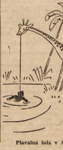
Plavalna šola v Afriki

V Šoštanju je bil okrajni sahovski turnir v počastitev desete obletnice osvoboditve. Turnirja so se udeležile vse nižje gimnazije v okraju - razen Ljubnega - in osnovne šole: Velenje, Šoštanj, Zavodne in Skorno. Veliko pozornost je vzbudila mlada šahistka Zunterjeva iz Velenja, ki je vse partije, razen ene, odločila v svojo korist.