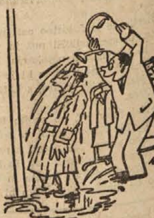
»No, ali zdaj verjamete, da je plač neprer očljiv?«