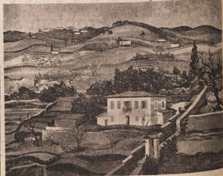
Stane Kumar: Primorska krajina, 1952, olje, platno