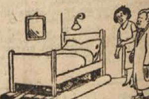
»Ja, po pravici rečeno, soba je nekoliko vlažna.«

»Ne, ne,« je odgovoril Tolstoj, »ta denar sem pošteno zaslužil in vam ga ne vrnem.«