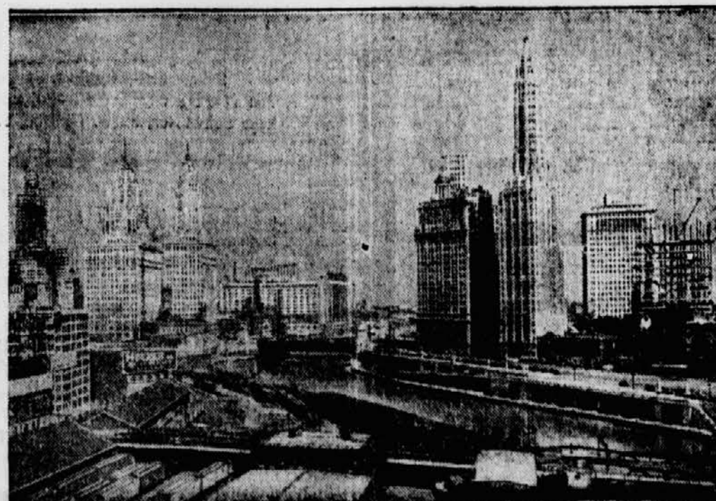
wird Chicago (U. S. A.) sein. Präsident Hoover hat in einem Aufdruck die Nationen zur Teilnahme an dieser Weltausstellung eingeladen, die zur Feier des 100jährigen Bestehens Chicagos als Stadt veranstaltet werden soll.

des Nährmittels „Ovomaltine“, das in der ganzen Welt verbreitet ist.