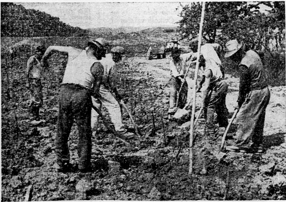
V Dobroven v Brdih so zadržniki zričgotali 10 ha dosegljavi neplovdnih površin, kjer že urejajo moderne nasade vinogradov.

VREME Napoved za sredo. Nestalno vreme s krajevnimi padavinami. Temperatura ponoči do 20 C. 695 dan 90 240 C.