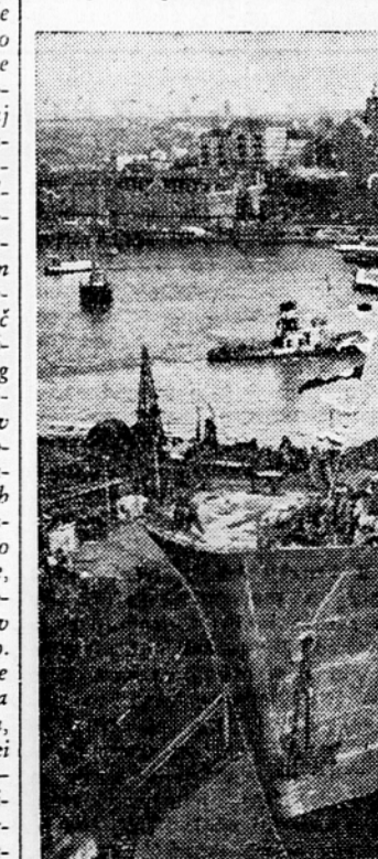
V göteborgskem pristanišču bodo te dni splovljale nove velike prekomorske ladje »Sage«, ki jo je izdelala največja švedska ladjedelnica »Getaverken« v Göteborgu.

motornimi čolni po jezerih, strelijo s puškami in prav tako vreščijo in se smejijo pri vseh teh zastavah, kakor, kot je bilo videti, uživa mladoletna mladina pri plezanju na prostorni ploščadi, v varietetih, in pri akrobatih — tudi v poznih večernih urah. To je našim razmeram in našemu pojmovanju precej tuje in nerazumljivo. Švedska mladina se precej rado opija z alkoholom in se z majavimi negotovimi koraki pozibava ponoči po ulicah, kljub visokim cenam pijače, zlasti žgani. To je tudi glavni problem, s katerim se ukvarjajo vse organizacije in partije, a ga ne morejo rešiti in preprečiti, kakor so nam povedali naši spremljevalci. Vzrok je, kar se mlačinice tiče, verjetno v tem, da je na Švedskem izredno pomanjkanje delovne sile in odhaja mladina razmeroma mlada v poklice, kjer dokaj dobro zasluži. V soboto smo si ogledali tovarno stekla »Surte Glasbruk« blizu mesta, kjer je ves proizvodni proces popolnoma avtomatiziran. V tej steklarni proizvajajo v glavnem samo steklenice za različne namene. Stroji izdelajo povprečno