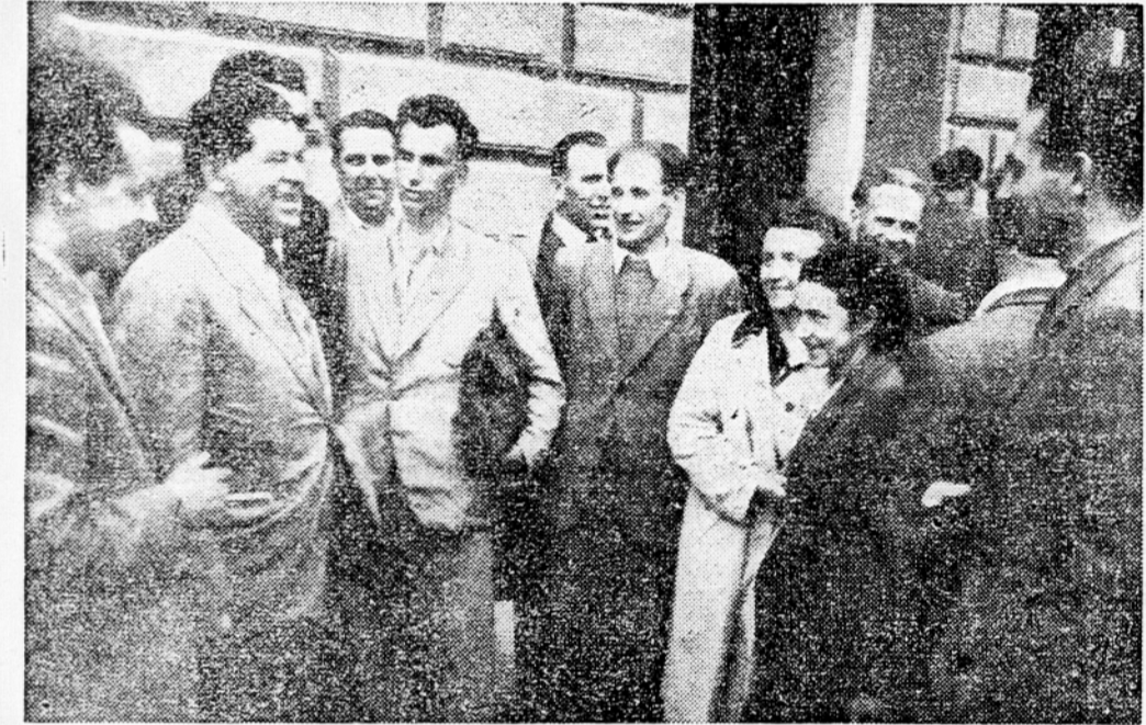
Goriški zadrzniki — delegati razpravljajo pred pričetkom zbora

delovne sile. Iz vsega tega se jasno vidi osnovno stremenje naše politike: Namesto birokratskega dirigiranja v gospodarstvu, ki kakršnemu smo bili v prejšnjih letih zaradi velikih težav prisiljeni, preprečiti z našo politiko največje anomalije in dati vzpodbudo za dvig produktivnosti dela v kmetijstvu in hkrati toliko izravnati bremena, ki naj jih naš delovni človek doprinese skupnosti, da bi na ta način lažje zmogli