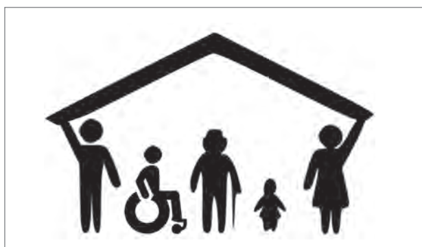
Slika 3: Sodelovanje in streha za vse prebivalce (vir: Delavnica študentov prostorskega načrtovanja, 2015).

rostnih skupin, vključenost javnosti v postopke odločanja in načrtovanja, vključenost z vidika možnosti izobraževanja in dostopnih delovnih mest ter čezmejno povezovanje. Z vključenostjo je tesno povezan pojem sodelovanja, ki bo krojil prihodnji razvoj države. Medgeneracijsko sodelovanje in skrb za starejše bosta pomembna na vseh področjih. Razvoj družbe bo trajnosten, zato bodo upoštevane tudi prihodnje generacije in skrb za njihovo kakovostno bivalno okolje. Znanje starejših bo pomemben del družbenega kapitala, saj se bo z njim utrdil in izboljšal njihov položaj v družbi, obenem pa se bo znanje prenašalo na mlajše generacije. Že v začetku karijerne poti bo dinamičen izobraževalni sistem omogočal visoko zaposljivost prebivalstva. Stopnja zaposlenosti bo zato visoka, saj bodo kakovostna delovna mesta dostopna višje in nižje izobraženim. Izobraževalni sistem bo temeljil na povezovanju izobraževalnih ustanov s trgom dela, velik poudarek bo na praktičnem delu in interdisciplinarnosti. Izobraževalne ustanove in podjetja bodo v medsebojnem sodelovanju pridobila nabor primernih kadrov, ki se bodo ustrezno usmerili in izobrazili že med šolanjem, večjo konkurenčnost, razvoj novih tehnologij in prepoznavnost, kar bo pripomoglo k lažjemu shajanju podjetij med gospodarsko krizo in nenehnemu sledenju svetovnim trendom.