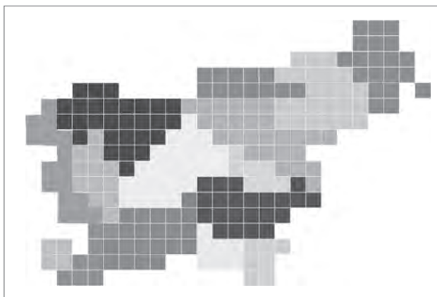
Slika 4: Delitev slovenskega prostora na prepoznavna regionalna območja

se bodo dejavno vključevali v procese načrtovanja (Delavnica študentov prostorskega načrtovanja, 2015).