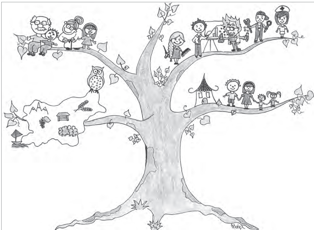
Slika 2: Drevo, ki ponazarja kakovostno življenjsko okolje Slovenije (vir: Delavnica študentov prostorskega načrtovanja, 2015).

rostnih skupin, vključenost javnosti v postopke odločanja in načrtovanja, vključenost z vidika možnosti izobraževanja in dostopnih delovnih mest ter čezmejno povezovanje. Z vključenostjo je tesno povezan pojem sodelovanja, ki bo krojil prihodnji razvoj države. Medgeneracijsko sodelovanje in skrb za starejše bosta pomembna na vseh področjih. Razvoj družbe bo trajnosten, zato bodo upoštevane tudi prihodnje generacije in skrb za njihovo kakovostno bivalno okolje. Znanje starejših bo pomemben del družbenega kapitala, saj se bo z njim utrdil in izboljšal njihov položaj v družbi, obenem pa se bo znanje prenašalo na mlajše generacije. Že v začetku karijerne poti bo dinamičen izobraževalni sistem omogočal visoko zaposljivost prebivalstva. Stopnja zaposlenosti bo zato visoka, saj bodo kakovostna delovna mesta dostopna višje in nižje izobraženim. Izobraževalni sistem bo temeljil na povezovanju izobraževalnih ustanov s trgom dela, velik poudarek bo na praktičnem delu in interdisciplinarnosti. Izobraževalne ustanove in podjetja bodo v medsebojnem sodelovanju pridobila nabor primernih kadrov, ki se bodo ustrezno usmerili in izobrazili že med šolanjem, večjo konkurenčnost, razvoj novih tehnologij in prepoznavnost, kar bo pripomoglo k lažjemu shajanju podjetij med gospodarsko krizo in nenehnemu sledenju svetovnim trendom.