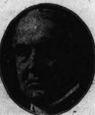
WARREN G. HARDING.

Velika republikanska stranka je vedno stala na braniku za pravice priprostega ljudstva. Stala je vedno odločno na strani delavca in žensk v tej deželi in za blagostanje s pospeševanjem pravice in boljše sporazumljenje med kapitalom, delavcem in farmerjev.