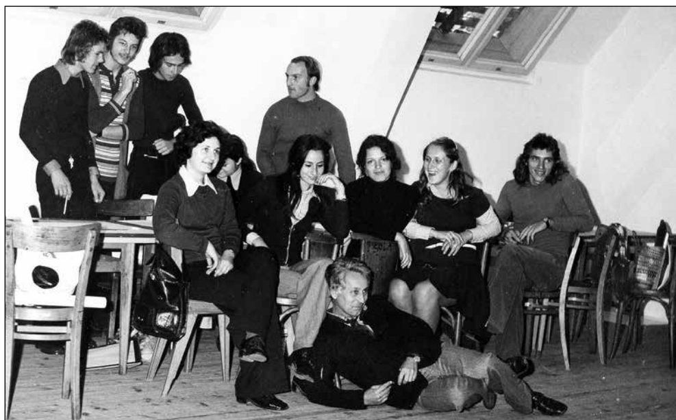
Križanke, Srednja šola za oblikovanje.

je naša dela ocenil, pokomentiral in nam svetoval. Obenem se je Pavlovec na naš račun rad tudi pošalil. Vedeti je treba, da takrat likovno, slikarsko izražanje in predstavljanje ni bilo tako enostavno, kot se danes zdi: Železniki smo bili grapa, Škofja Loka pa umetniki! Loka je v začetku zviška gledala na dolino.