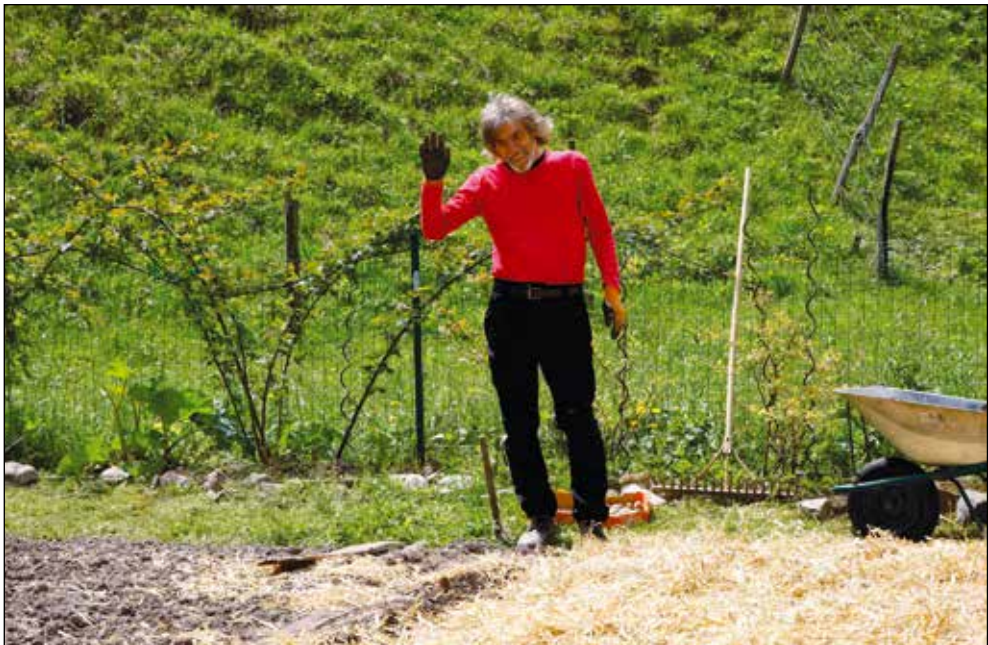
Zemljo se bogati in ščiti s pokrivanjem.

Let in časa ne poznam. Ga enostavno nisem vzel. Koliko sem star? Ne vem. Nimam časa ali časa je premalo, zame ne obstaja, imam ga 24 ur. Zato sem tudi razočaran, ko ugotovim, da prijatelji, ki so vedno imeli čas priti na kavo in kratek klepet ali pa jaz k njimi, tega časa sedaj, ko so upokojeni, nimajo več! Ne razumem, saj ga imajo osem ur več zase! Ljudje