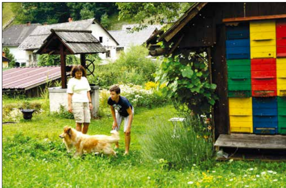
Sožitje ljudi, živali, narave.

Medtem ko običajno prezimijo v redu, nas je lani pri-