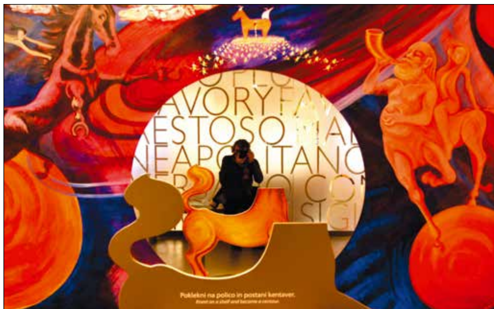
Trenutek v grški mitologiji.

Zdi se mi absurdno, ko vidim, kaj se ljudem zdi pomembno, za čem se je vredno gnati. Tibetanci