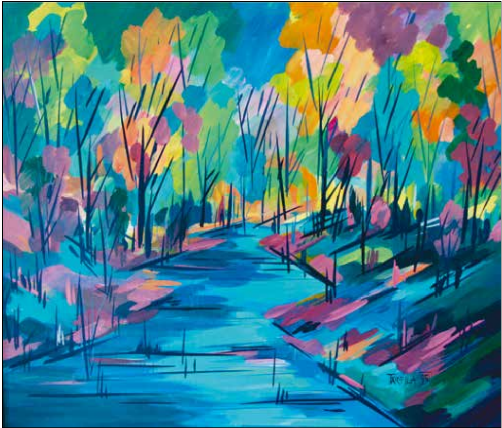
"Prihod sonca". Akril na platno.