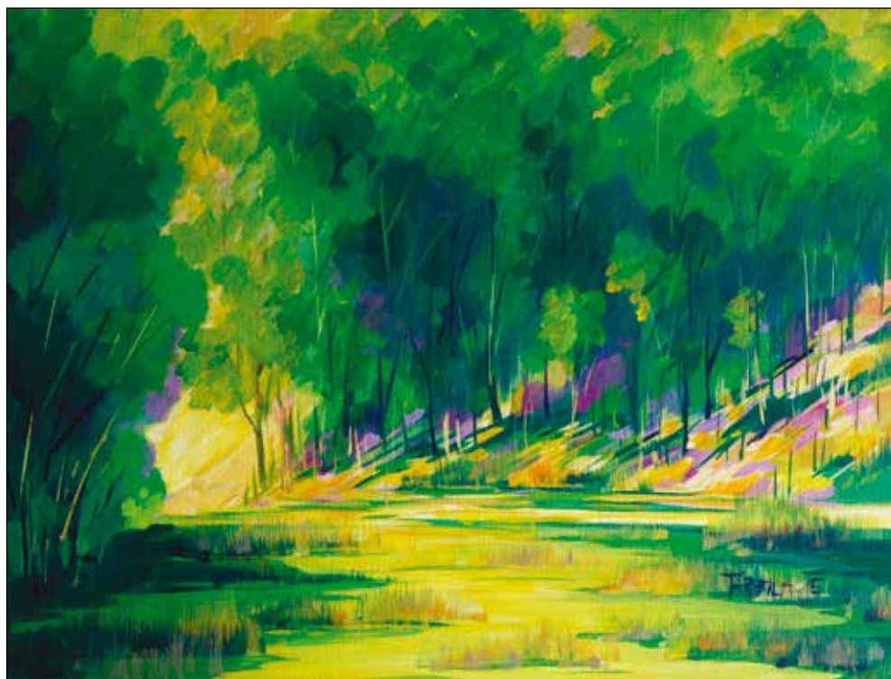
"Prihod svetlobe". Akril na platno.