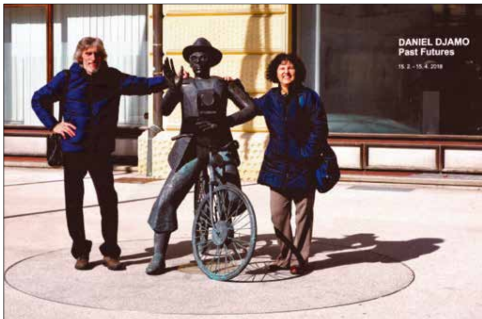
Velika čast je srečati slovenskega mojstra fotografije.

Slikam lahko kjer koli. Prostor ni pomemben, vsak