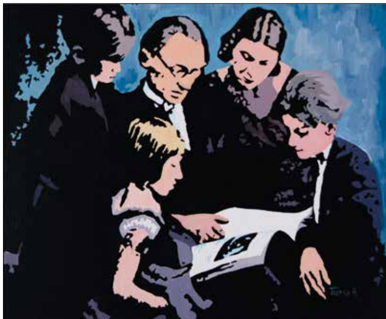
"Oton Župančič bere uganke". Akрил na platno.