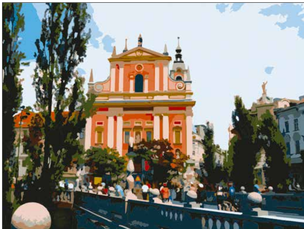
Simfonija lepega – Tromostovje.