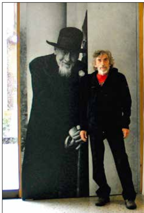
Srečal sem skromnega, a velikega človeka.