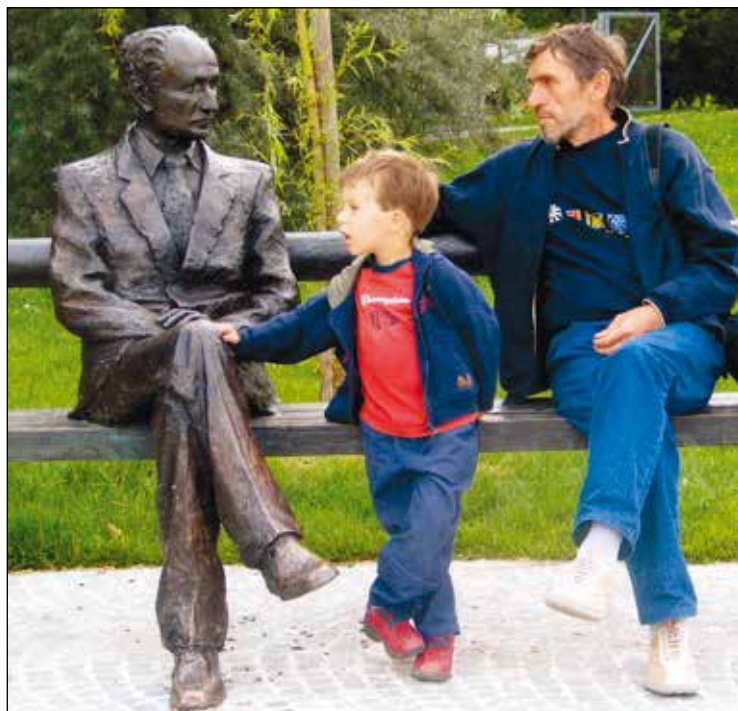
Prekrižala sva nogi in beseda je stekla.