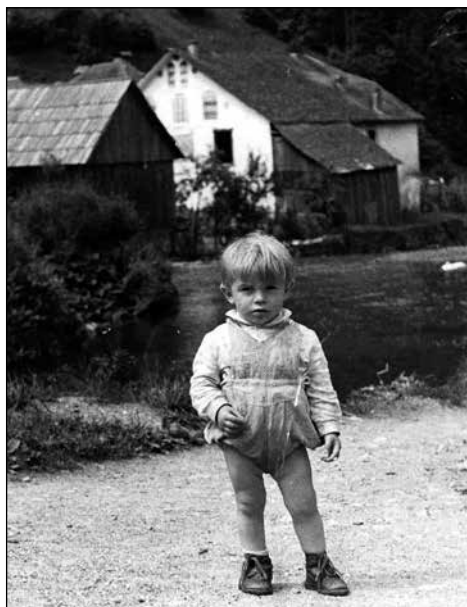
Svet je velik.

šel sem h grabnu, našemu potoku, s seboj sem imel barvice in sem narisal rožice! In te so bile prve, ki sem jih resnično začutil. Začutil sem, da je risba prava. Zdelo se mi je, kot bi se nekaj v meni prelomilo. Ta prizor imam še vedno pred očmi, kot bi se zgodil pred kratkim.