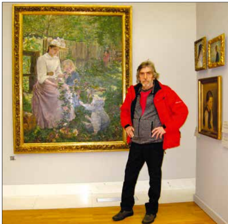
"Poletje" – sonce, cvetje ...

Loki, Grandis – Brdo pri Kranju, Dolik na Jesenicah, Galerija muzeja v Železnikih itd. Skupno sem pripravil 30 samostojnih in sodeloval na 150 skupinskih razstavah.