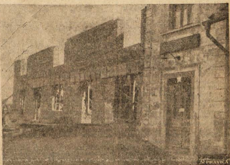
V Pesjem tekmujejo, da bi bil dom dograjen do 1. maja

Prvo nedeljo je bilo dograjene že polovica dvorane, ko so pa delali zadnjič so »potegnili« že do strehe. Aktiv mladine Pesje je dobil na okrajni konferenci priznanje, da je najboljši aktiv LMS pri gradnji zadružnih domov. Vzgljed KLO Pesje bo pospešil delo tudi pri drugih KLO-ih, kjer delo ne gre tako naglo.