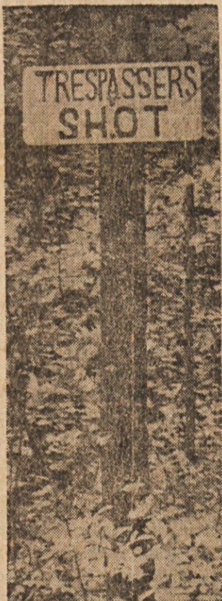
KRATKO IN JASNO — Lastnik tega gozda je povedal jasno vsem, ki bi jih našel tam brez svojega dovoljenja, da bodo — USTRELJENI.