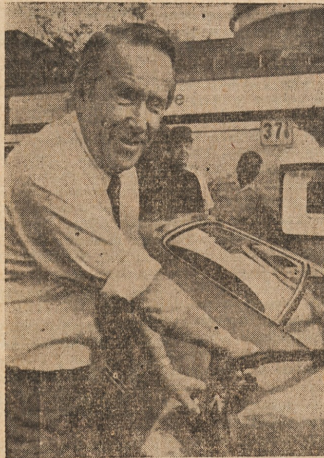
SEN. HENRY JACKSON, demokrat iz države Washington, si na svoji kampanjski poti, ko išče podporo za pridobitev imenovanja za predsedniškega kandidata demokratske stranke, sam nataka gasolin na postaji, ki ga v takem slučaju prodaja nekaj ceneje.