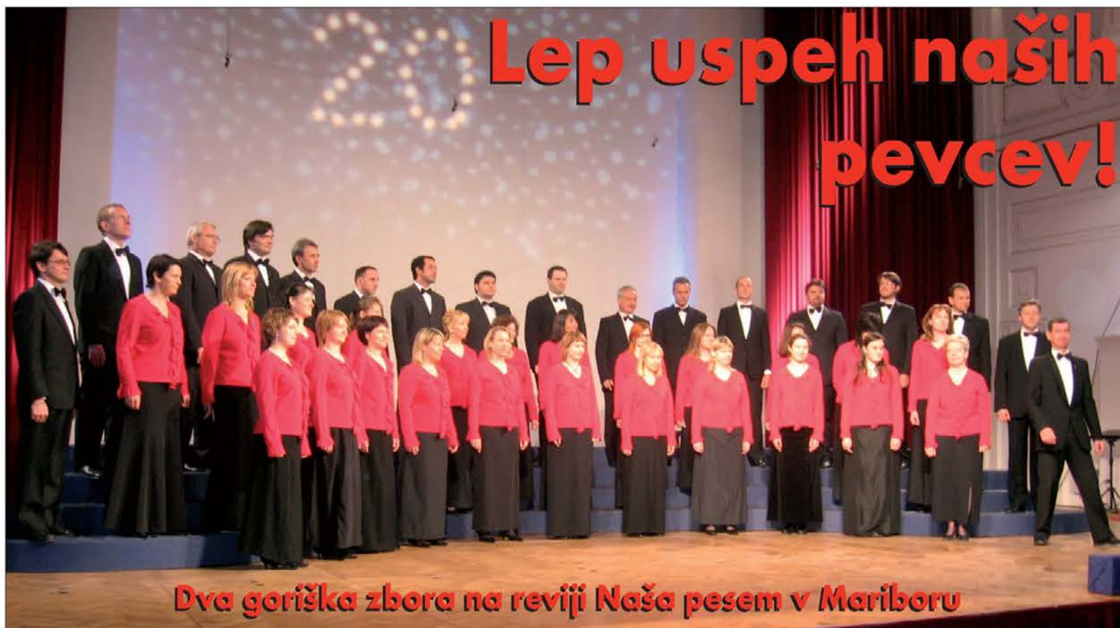
Dva goriška zbora na reviji Naša pesem v Mariboru

Nimamo je zato, ker nismo verodostojni, ker se ne držimo pravila: "Tudi če vsi, jaz ne!"