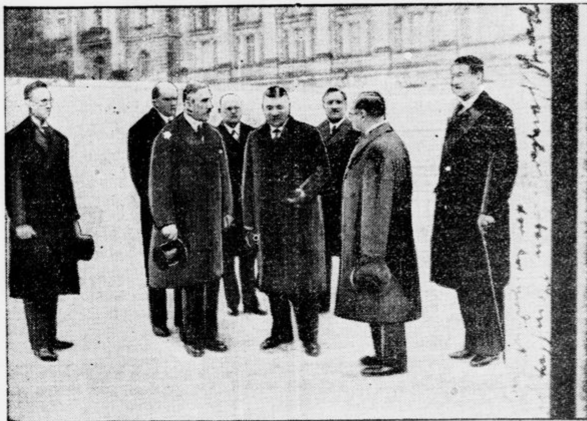
Kancelar Papan je te dni obiskal Monakovo, kjer je z bavarskim ministrskim predsednikom obravnaval vprašanja, ki se tičejo Prusije in južnih nemških dežel