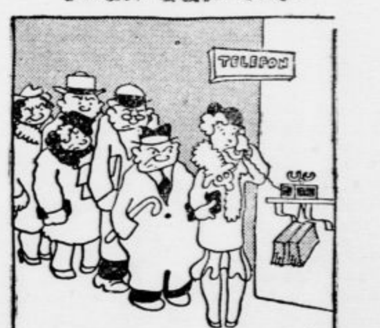
»Svedea sem točna, dragec! Saj veš, da ne dam nikoli nikomar čakati name.«