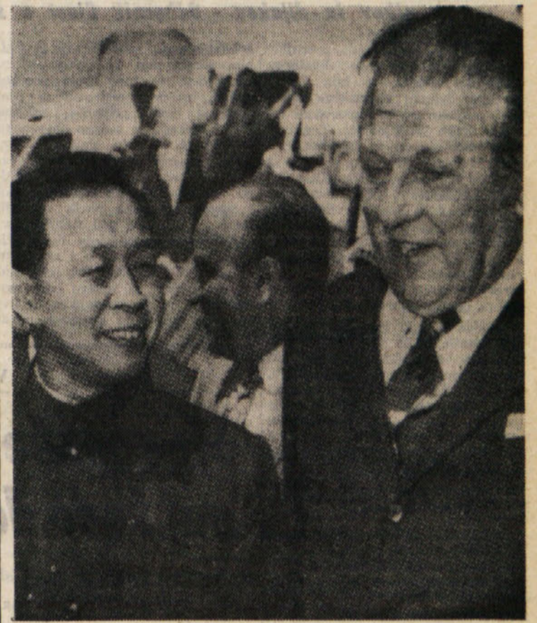
Minister za zunanjo trgovino Mario Zagari je včeraj obiskal predsednika ministrskega sveta Colomba ter mu poročal o rezultatih svojega obiska na Kitajskem. Na sliki: minister Zagari ob povratku v Rim, kjer ga je na letališču pričakal kitajski veleposlanik Sen Ping