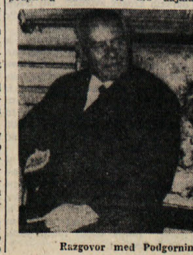
Razgovor med Podgornim (levo) in Sadatom.