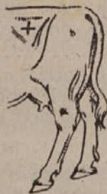
Točka, kjer naj se napravi vbod s trokarjem, je zaznamovana s križem.