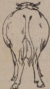
Hudo napeta žival.

Napetost se skoro redno pojavlja nenadoma, v par minutah: žival hitreje in težje diha. Bolezen poteka grozno hitro. V par urah lahko žival pogine. Le redko je mogoče pravočasno poklicati živino-zdravnika na pomoč.