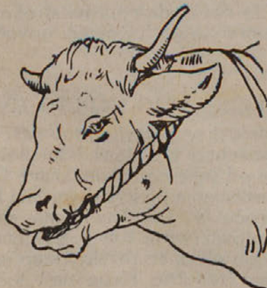
Kako se vtakne slamnata vrv v gobec hudo napete živali. (Iz «Domenica dell'Agricoltore»).

Blizu zadnjega rebra (3—4 prste višje) in na vodoravni črti, ki drži od njega do bedrenice, približno v sredi trikota, ki ga