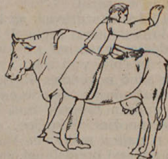
Kako se vbod izvrši.

Kedar smo gotovi, da se v želodcu ne razvijajo več plini, izvlečemo z eno roko prav previdno in počasi cev iz rane, z dvema prstoma druge roke pa stiskamo rano ob robih, da se preveč ne privzdignejo, kar bi v spodnjih