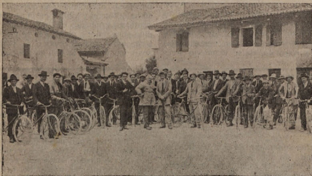
Izlet kmetijske nadaljevalne šole v Biljah s kolesi v Furlanijo.

V prvem letu se je vpisalo v šolo mnogo kmetijskih mladeničev in posestnikov, vsled česar se je poučevalo v dveh oddelkih: prvi v Biljah s 33 učenci, drugi na Gradišču pri Renčah s 46 učenci. Obisk predavanj je bil dovoljen in ločen. V letošnjem tečaju je bilo vpisanih