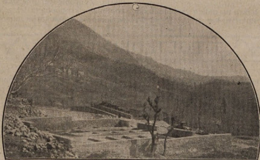
Skupni gnojnik v Postalesio.

Priobčeni dve slikj govorita dovolj jasno, kakšen je gnojnik. S tem je tudi odpravljena navidezna smešnost, ki jo