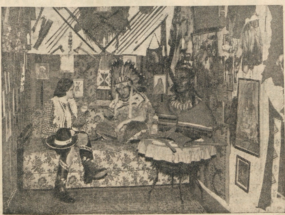
Indijanski vlgvam, v katerega je prodra civilizacija? Ne, to je soba nekega Berlinčana, ki se mu je po čitanju indijancerke vzbudila tolikšna simpatija do Indijancev...