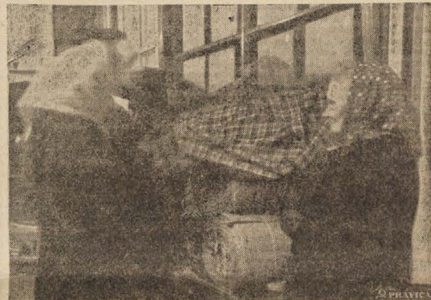
Nameščenev v sindikalnem magazinu kljub obilici dela rade volje razkazuje potrošnikom blago

boljše blago in tudi dovolj. Sedaj ima trgovino že lepo založeno, odšla pa je še, ko ji je tovariš v skladišču »za gotovo« obljubil, da dobi še bejo flanelo, ki jo večina mater raje kupi kot barvano in še nekaj bal takega in drugačnega lepega blaga.