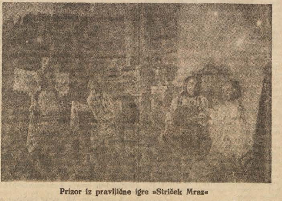
Prizor iz pravljčne igre »Striček Mraz«

Mesec dni pozneje, v februarju, so uprizorili slušatelji Akademije za igralsko umetnost pravljčno igro »Striček Mraz«. »Striček Mraz« je igra po znanem starem motivu o hudobni mačehi, njenih muhasti in hudobni hčerki in trdo izkorisčani pastorki. V osvetljevanju M. Šurinova je ta motiv doživljal tisto etično premalo nitevo, ki ga je doživel značaj dela iz njegove tvorne sile v socialistični družbi — iz razgovora o predstavi »Strička Mraza« z rektorjem Akademije za igralsko umetnost izhaja, da so dali igralcem »vse možnosti samostojnega igralskega dela« za pravljčno igro in da je »njihovo igralsko delo usmerjal samo režiser« (Gledališki list št. 2 1948). Tako torej so mladi igralci mogli iz svojega šolskega znanja prenesti v to igro le kos splošnih spretnosti, ki naj jih je prekvasila tvorna