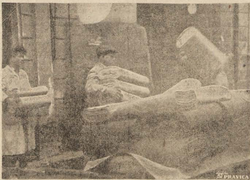
Iz skladišča razvozijo dnevno na tisoče metrov blaga v mestne prodajalne

Tako se ves dan vrste skozi trgovino ljudje in nameščenci jim vkljub obilici dela razkazujejo blago in razlagajo n. pr. kako narediti, če je 40 točk, ki jih potrošnik lahko porabi v prvem četrtletju, premla za nakup kakšnega artikla. »Tukrat si izposodite točke od žene, sestre, brata ali matere, skratka od vse ožje