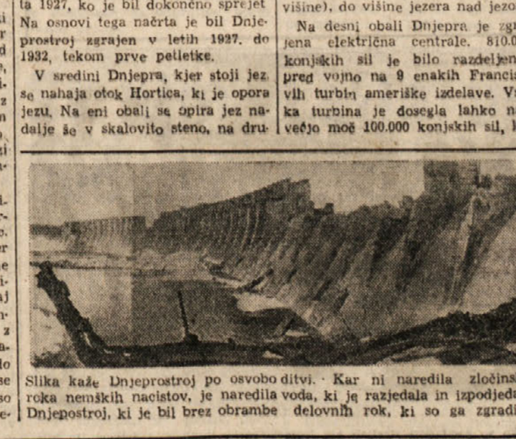
Slika kaže Dnjeprostraj po osvojitvi. Kar ni naredila zločinska roka nemških nacistov, je naredila voda, ki je razjedala in izpodjedala Dnjeprostraj, ki je bil brez obrambe delovnih rok, ki so ga zgradile.

dar je bilo v reki največ vode. Vsako kolo turbine ima težo 160 ton in premer 6,5 metra in se zavrti 88 krat na minuto. Pred vojno je Dnjeprostraj dajal 810.000 konjskih sil. Ob stitih meseceh, pozimi v pomem poletju in jeseni je bila njegova moč nekoliko manjša, a v tem razdobju je prisla vedno na pomoč Dnjeprostraju, ostala električna industrija, ki je z njim povezana v eno celoto, na prepotno pa pomladi kaže Dnjeprostraj svojo pomoč vsej industriji in rudnikom Doneckega bazena. Električna energija iz Dnjeprostroja pomaga tudi pri črpanju vode iz rudniških rovov. Te izkušnje iz preteklosti so prepričale strokovnjake, da se lahko izrabijo prirodne sile Dnjepra še bolj, tako da je v načrtu povdane njegove kapacitete za 19 odst. V poslednji vojni je bil Dnjeprostraj težko poškodovan. Jez je bil delno porušen, vse naprave, instalacije in stroji pa so bili popolnoma uničeni. Nadaljno veliko škodo je naredila voda, ki je izpodjedala in razdirala v času, ko je bil Dnjeprostraj brez obrambe in pomoči človeških rok. Danes je po štirih letih vojne obnovljen ves jez in nasip, obnovljena je tudi zgradba elektrocentralne in trenutno že delajo ponovno štiri turbine. Peto pravi sedaj ponovno vgrajujejo. A hidrocentrala »Lenina« na Dnjepru je le ena izmed mnogih, ki se grade ali pa obnavljajo v Sovjetski zvezi, sedaj grade na Volgi večjo centralo, pri Kujbiševu, ki bo dajala mnogo večjo silo kot Dnjeprostraj.