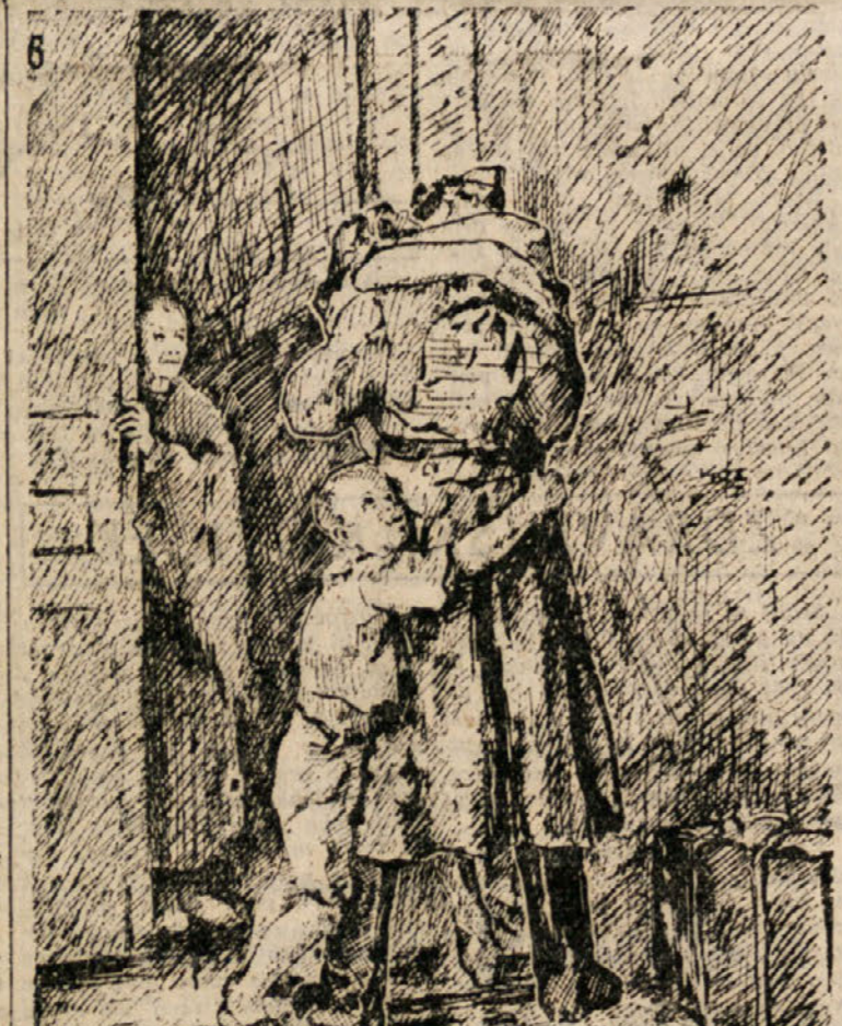
Matere, žene, moške in očete, hčere in sinove, danes je še čas. Preprečimo, da se ne bi ta slika ponovila v naših družinah!