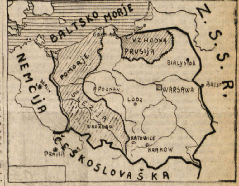
Crtae predele na zemljevidu je dobila Poljska po kosačni drugi svetovni vojni.

Vrednost proizvodnje v letu 1949 se bo primeru z ono iz leta 1948 dvignila za 39,5%, produktivnost se bo pa dvignila za 17%. Proizvodne možnosti se bodo dvig-