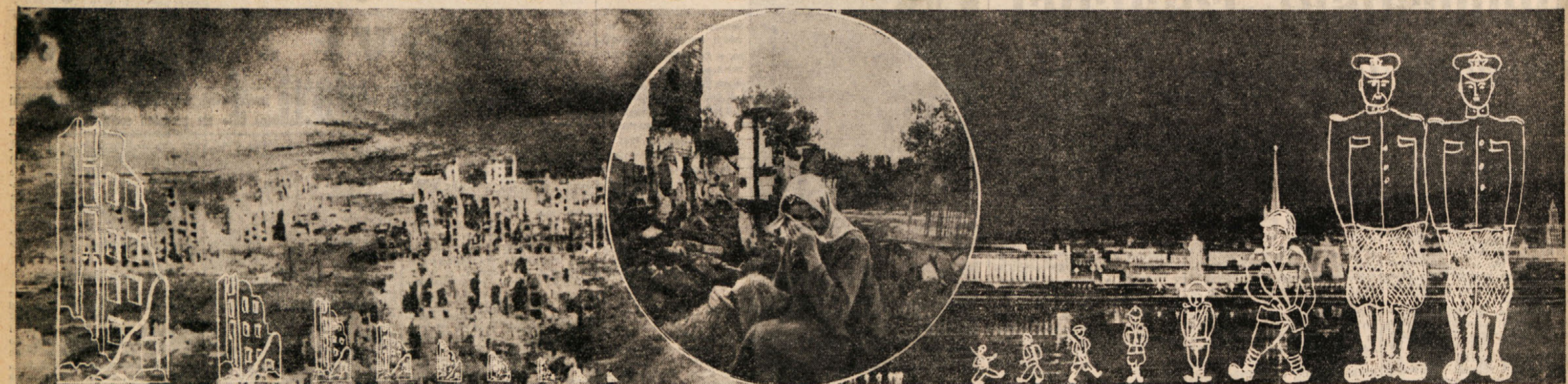
Razrušenja v milijonih dolarjev: Sovjetska zveza 128.000, Francija 21.000, Poljska 20.000, FRJ 10.500, Anglija 6.800, ČSR 4.200, Grčija 3.200, Združene države ni, ZDA so imele več mrtvih v prometnih nesrečah kot v vojni, Združene države 250.000, Anglija 400.000, Grčija 500.000, Francija 600.000, FRJ 1.700.000, Poljska 4.800.000, Sovjetska zveza 22.000.000, Človeške žrtve

V sliko levo so vrisane izgube v materialu, ki so jih utrpeli posamezne zavezniške države. Razrušenja so izračunana v dolarjih. Medtem ko je imela Sovjetska zveza za 128.000 milijonov dolarjev upuščenih, niso imele Združene države Amerike nič. (V sliki sami vidimo grafični prikaz, spodaj so številke). Na sliki desno so vrisane izgube v človeških žrtvah (v sliki grafično, pod sliko v številkah). Sovjetska zveza je izgubila 22.000.000 ljudi. Velike so tudi izgube v ostalih deželah Evrope, posebno v deželah ljudske demokracije. Amerika je izgubila 250.000, to je manj kot je bilo prometnih nesreč v istem času. — Iz teh števil lahko vsak sam vidi, kdo je imel najmanj žrtev in materialu in je tako v vojni najmanj preizkusil, a istočasno največ zaslužil. Tekom vojne so zaslužili ameriški kapitalisti 22,7 milijard dolarjev. Zato želijo danes le kapitalisti (v prvi vrsti Amerike) vojno a ne demokratične sile, ki so imele, čeprav zmagovite, silne žrtve.