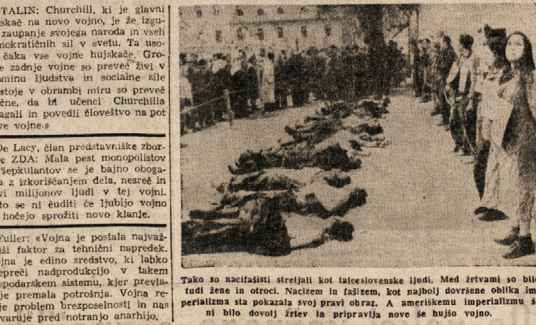
Tako so nacifasisti streljali kot talcoslovenske ljudi. Med žrtvami so bilo tudi žene in otroci. Nacizem je bila aretirana čun je prišla v bližino kipa svobode. V lastni deželi so ti nazadnjaški vojnohujskaški krogi proti lastni kulturi, a navzven pa poskušajo izvažati svoje isto znano protikulturno proizvodno detektivskih, pornografskih in drugih kvarljivih romanov in filmov, ki poskušajo vnanjem golote in vznemirjenem spolovanju in zablavljenosti uničiti v človeku vse njegove boljše človeške občutke, njegovo zanimanje za družbene in socialne probleme, a

Tekom vojne je ameriška industrija narasla na dvojno višino (indeks proizvodnje je znašal 245, v nasprotju z leti 1935-39, ko je znašal 100. Leta 1947 je bil indeks proizvodnje v ZDA 189). Če ne bo vojne bodo morali zmanjšati ameriški kapitalisti težko industrijo še vsaj za 45 milijard, a to pomeni, da bodo letno imeli 20 odst. dobička manj, to pomeni gospodarski polom in krizo. V borbo proti imperializmu, ki hoče vojno, opustošenja in nove človeške žrtve! Enotnost vseh poštenih ljudi vsega sveta bo rešila mir in življenje ter dostojne delovne pogoje človeštva.