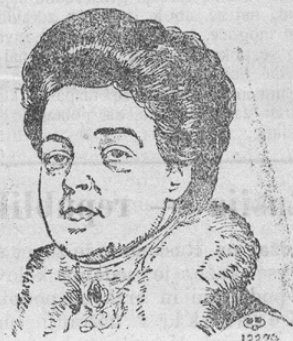
Königin Elenore von Bulgarien †.

Umrla je soproga poštenega našega zaveznika bolgarskega kralja Ferdinanda. Pokojnica je bila velikodušna kraljica in blaga žena. Na strani svojega kraljevskega vladarja, ki nam je zvesti prijatelj in zaveznik, preživela je težke čase prve in druge balkanske vojne. Doživela pa ni konečne zmage, ki boče tudi bolgarskemu kralju prinesla mogočno bodočnost. Umrla kraljica Eleonora pa je bila tudi prava mati svoji državi. Zato joka ob njeni gomili ves bolgarski narod, pa tudi mi zavezniki čutimo vso pretresljivo žalost te prerane smrti.