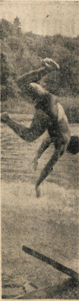
SREČEN SKOK V NOVO LÉTO, ČEPRAV TUDI NE V ZDAJ PREMZRLO KRKO!

Znana dunajska igralca Paul Hörbiger in Hans Moser sta bila v Parizu. Pozno ponoči se vrata v svoj hotel in zaideta v prazno stranjsko ulico. Zaidci jima prideta nasproti dva sumljiva pariška apaša. Pa pošepeta Hörbiger Moserju: »Obrni se nazaj in zbeži. Pogledaj: dva sta, midva pa čisto sama...«