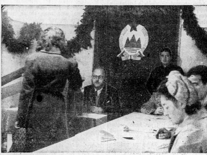
Na novomeškem volišču