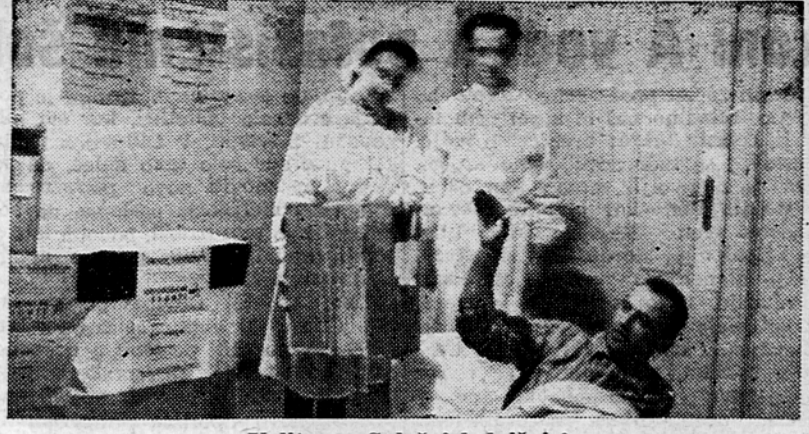
Volitve v Splošni bolnišnici

Prebivalstvo Sv. Križa nad Mariborom, ki si je v januarju zastavilo nalogo, da napelje električno luč v svojo vas, je te dni doživelo otvoritev elektrifikacije svojih domov. Pred novim vaškim transformatorjem se je zbrala množica ljudi, da slovesno proslavi uspehe izvršenega dela vaščanov in uslužbencev DES-a, ki so ob vsej pomoči ljudske oblasti v tako kratkem času uresničili svoje želje.