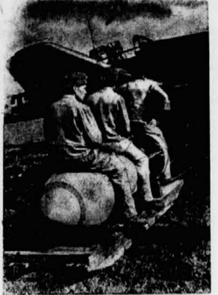
Drei Mann und eine Bombe Die drei, die für das Einhängen der Bomben in die Haltevorrichtung des Stuka zu sorgen haben, lassen sich von ihren Kameraden mit der Bombe zum Flugzeug schleifen

Am Samstagabend hatte der Gauleiter in der Landstube vier alte Parteigenossen die ihnen vom Führer verliehenen goldenen Ehrenzeichen der NSDAP überreicht und 50 Parteianwärter aus dem Steirischen Heimatbund in die Bewegung des Führers aufgenommen. Aufs eindringlichste hielt der Gauleiter den neuen Parteigenossen vor Augen, daß wenn man eintrete in die Gefolgschaft des größten Mannes, den unser Volk hervorgebracht habe, man in diesem Augenblick Träger eines großen weltgeschichtlichen Geschehens werde. Vor allem, so hob der Gauleiter hervor, brauche die Garde des Führers eines Menschen die ihre starken Herzen auch in den härtesten Zeiten bewahren, die unerschütterlich an den Sieg glauben.