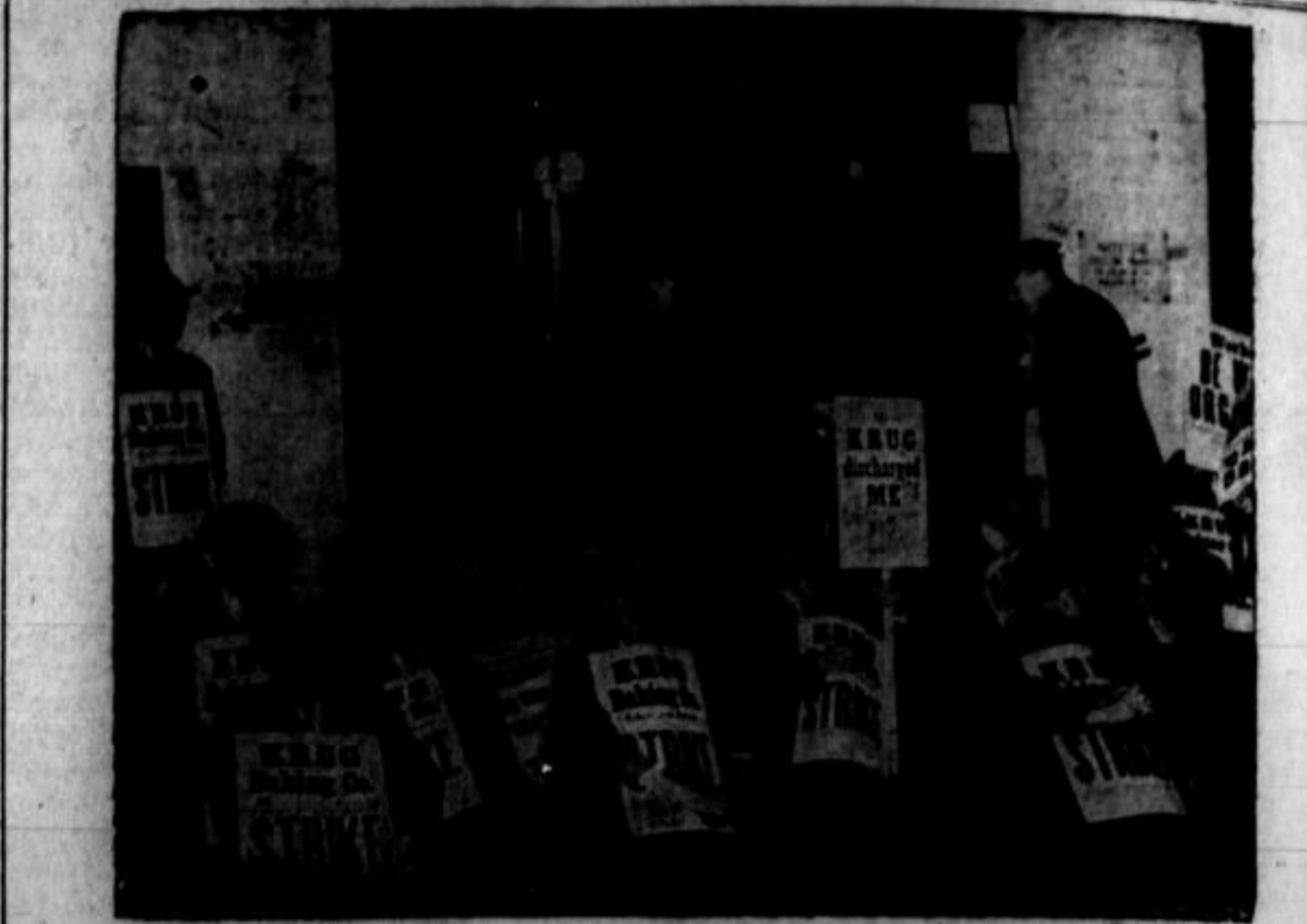
Člani unije Bakery & Confectionery Workers v stavkovnih demonstracijah pred pekarnico Krug Baking Co. v New Yorku.

Washington, D. C. - (FP) - Uradni Washington se je zdaj, ko bruseljska konferenca ni odredila nobene akcije proti Japonski, pričel zanimati za pogajanja med angleško in nemško vlado v Berlinu. Angleški toriji so izbrali viskonta Halifaxa