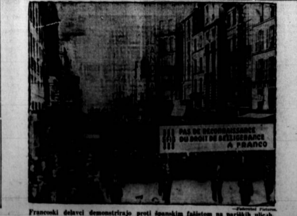
Francoski delavci demonstrirajo proti španskim fašistom na pariških ulicah.