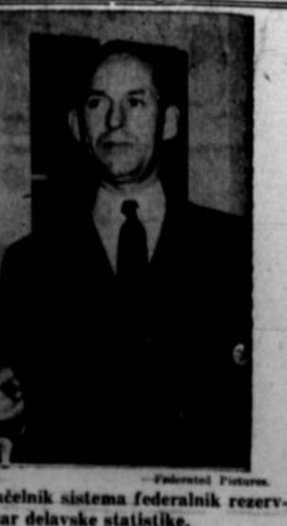
Marriner Eccles (desno), načelnik sistema federalnih rezervnih bank in Isador Lubin, komisar delavske statistike.

Richmond, Calif. — Redkokdaj se oglašimo iz te okolice. Dokler smo zdravi in veseli in dokler lahko zaslužimo za naše proletarsko življenje, nimamo nobene pritožbe.