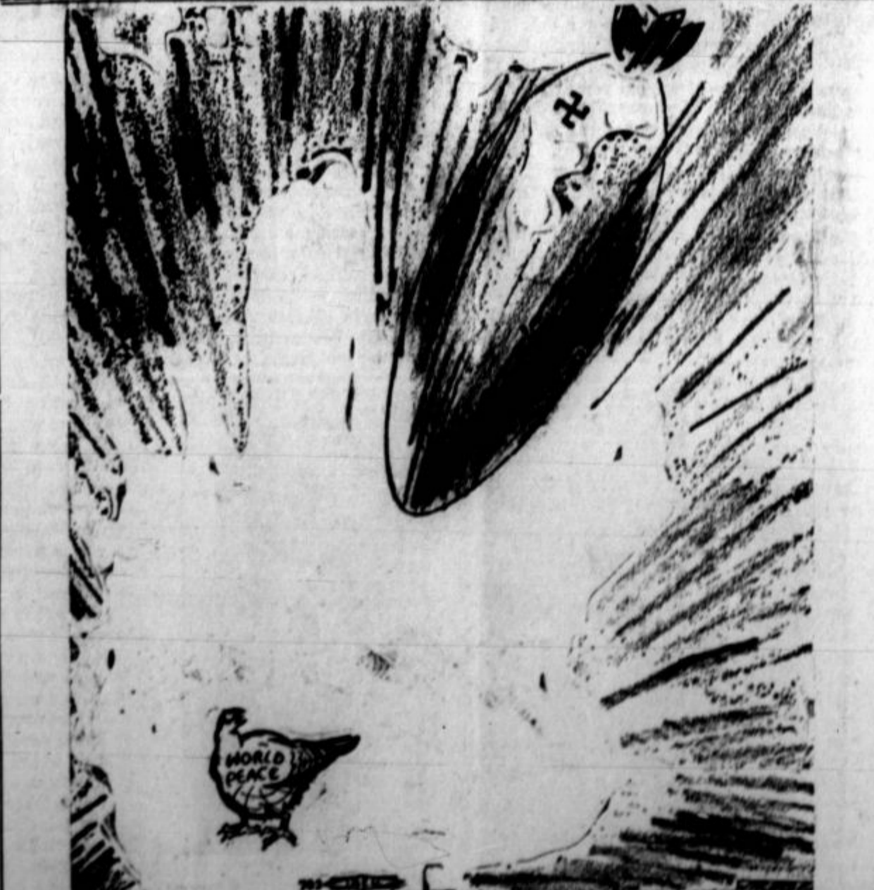
Agresivnost fašističnih držav spet ograža svetovni mir. (Narisa! Jerger.)

Ko je potekel čas ultimata, jih je provokator zopet pričel izzivati, češ, da se ga ne upajo dotakniti, nakar se je vanj zakadil neki delavec, ki bi ga bil sam zdelal, ako bi tega ne preprečili drugi delavci. Ravnatelj je takoj odsvolil vse unijske zaupnike v departmentu in ukazal ostalim delavcem, naj zapuste tovarno. Namesto tega so pa pričeli s sedečo stavko, ki se je naglo razširila na druge depart-