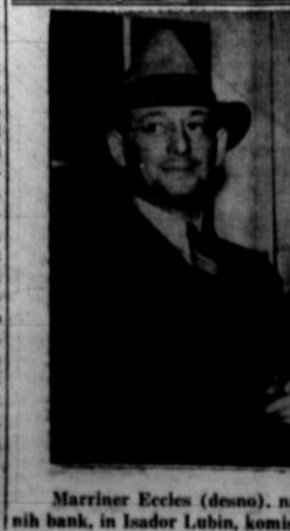
Marriner Eccles (desno), načelnik sistema federalnih rezervnih bank in Isador Lubin, komisar delavske statistike.