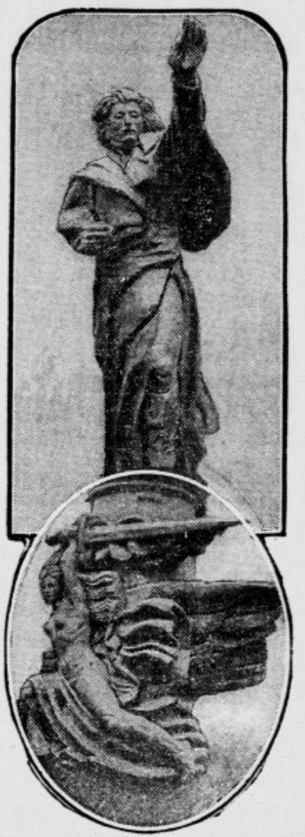
Spomenik poljskemu geniju V Parizu so odkrili visok spomenik poljskemu pesniku prvak Mickiewicz, ki naj bi služil kot dokaz prijateljskih odnosov med poljskim in francoskim narodom. Zgoraj spomenik, spodaj motiv na podstavku.

na znanstveni postaji sovjetskega geografskega zavoda na Novi zemlji in je ugotovil zanimivo dejstvo, da na tem otoku kakšnih škodljivih klic ali mikrobov sploh ne najde, ne v vodi, ne v zemlji, ne v zraku. Celotna divjačina, ki so jo ulovili, se je izkazala prosta takšnih mikroorganizmov.