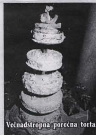
Večnadstropna poročna torta

in raznovrstne sladice iz lastne slaščičarske delavnice vseh okusov in oblik za vsakršno priložnost - že za 1.800 SIT/kg. Naročite danes, prevzamete pa že naslednji dan!