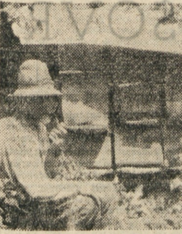
Stari sistem čebelarjenja v kranjih.