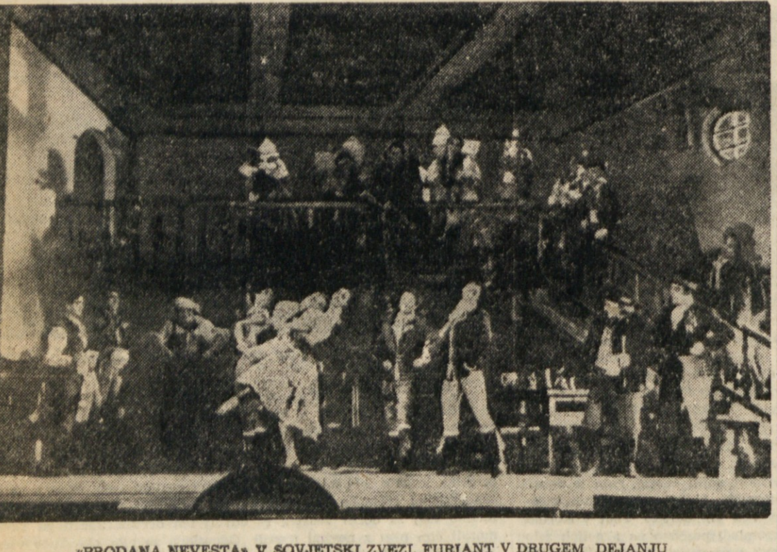
„PRODANA NEVESTA“ V SOVJETSKI ZVEZI. FURIANT V DRUGEM DEJANJU