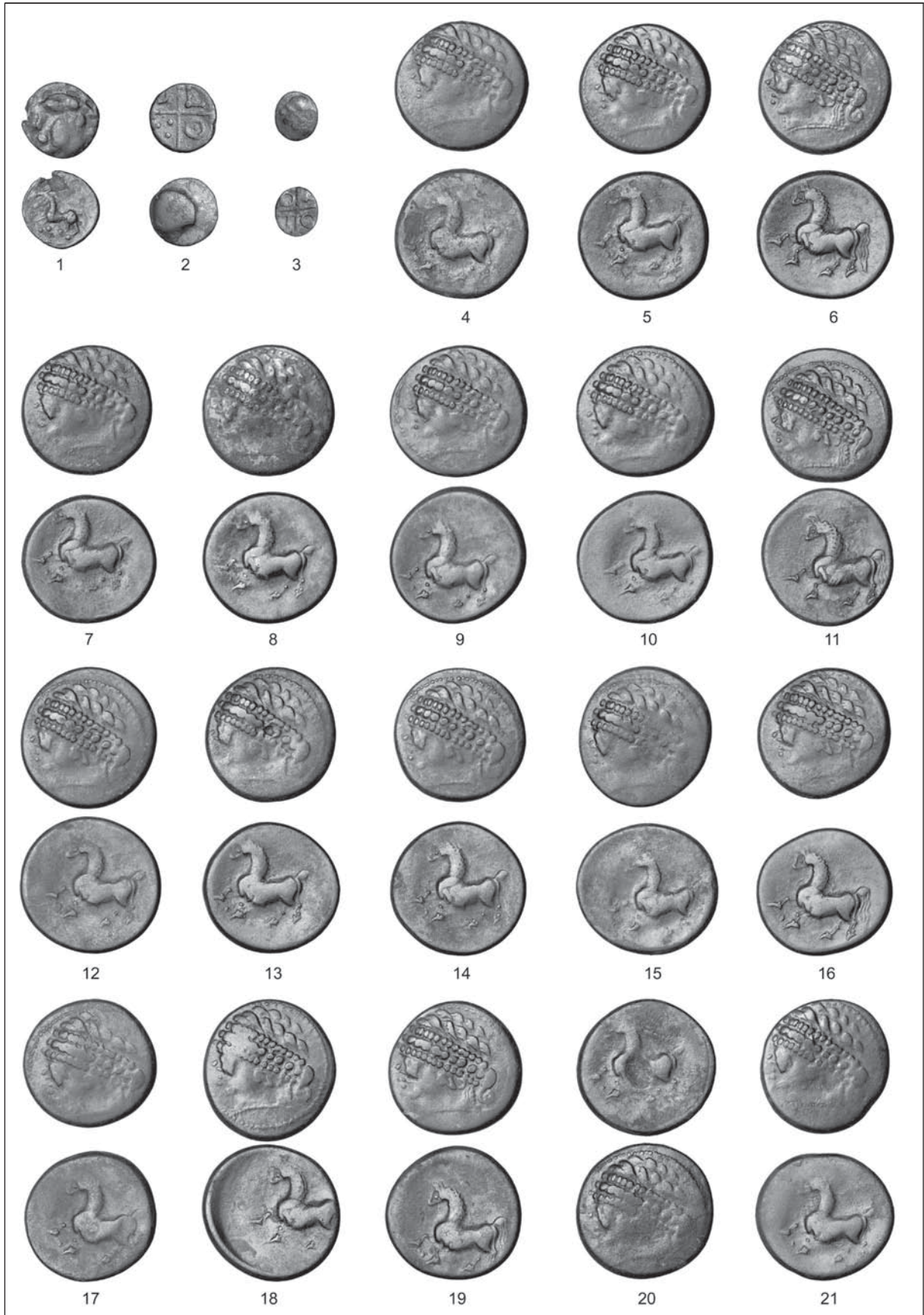
T. 1: Skupna novčna najdba Ljubljana. M. = 1:1.