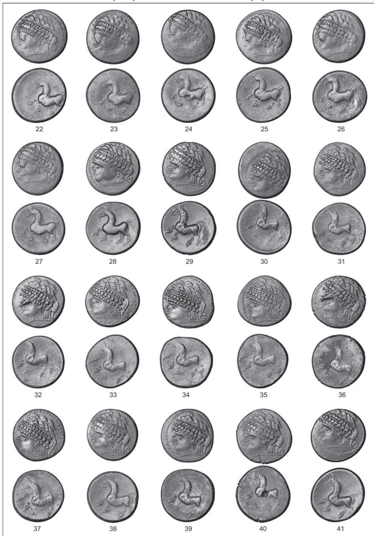
T. 2: Skupna novčna najdba Ljublanica. M. = 1:1.