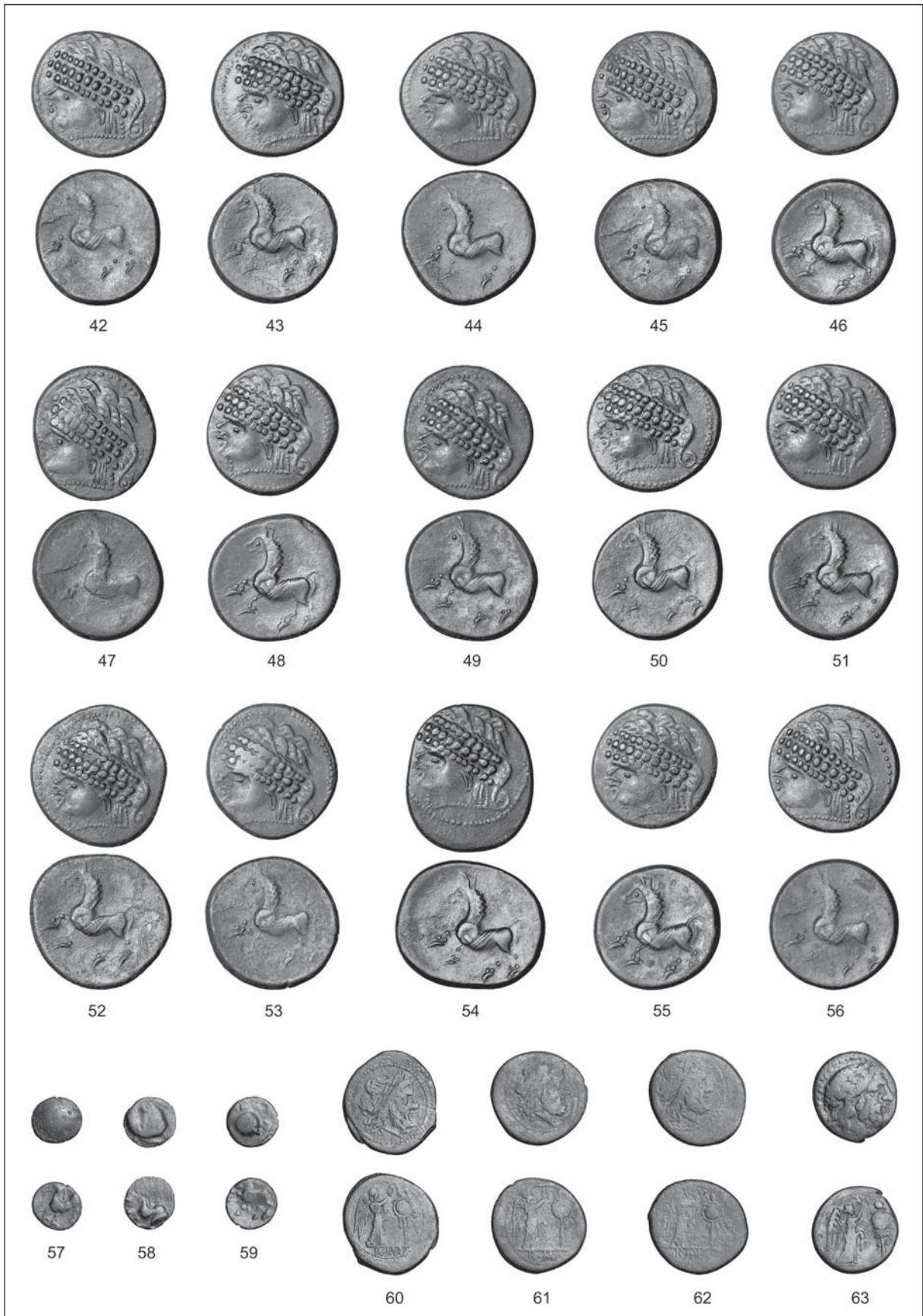
T. 3: Skupna novčna najdba Ljubljana. M. = 1:1.