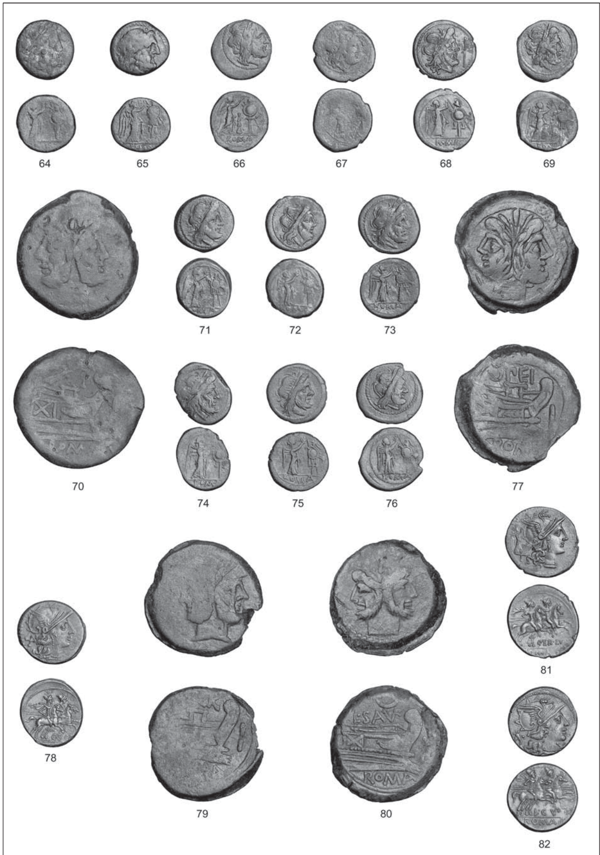
T. 4: Skupna novčna najdba Ljublanica. M. = 1:1.