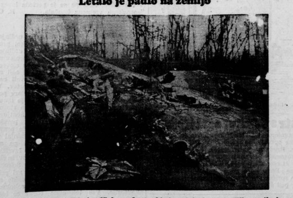
Nemško letalo tipa Dornier 17 je za francoskimi postojankami treščilo na tla in se razbilo

DRAMA Sobota, 9.: Tri komedije. Premiera. Premierski abonma. Nedelja, 10. ob 15.: Neopripravljena ura. Izven. Znižane cene. Ob 20.: Tri komedije. Izven. Znižane cene. Ponedeljek, 11.: Številka 72. Red A. OPERA Sobota, 9.: Sveti Anton, vseh zaljubljenih patron. Izven. Izredno znižane cene od 24 din navzdol. Nedelja, 10. ob 15.: Poljub. Izven. Izredno znižane cene od 24 din navzdol. Ob 20.: Gorenjski slavček. Izven. Znižane cene od 30 din navzdol. Ponedeljek, 11.: zaprto. BENTJAKOVSKO GLEDALIŠČE Začetek ob 20.15. Sobota, 9.: Kurent. Nedelja, 10. ob 15.15.: Kurent