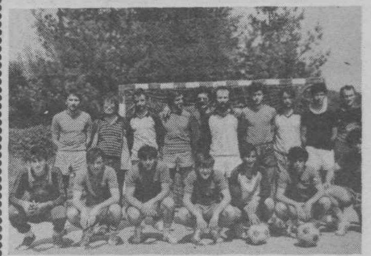
Zmagoviti ekipi AZ 66 in Bife Kajič